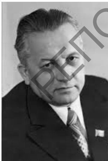
Малюнак 3 – Іван Шамякін, 1985