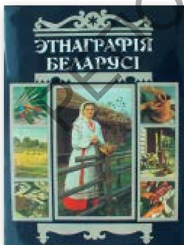
Малюнак 1 – Вокладка выдання «Этнаграфія Беларусі», рэдактарам якога быў Іван Шамякін, 1989