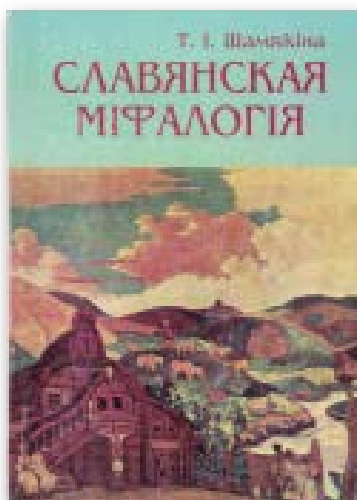
Малюнак 2 – Вокладкі выданняў Таццяны Шамякінай па міфалогіі і літаратуразнаўстве, 2001 – 2005