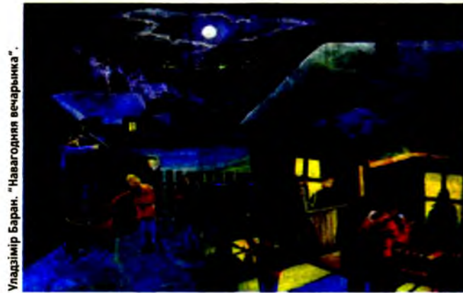
Уладзімір Баран. “Навагодні вечарынка”.

Сталічная галерэя “Універсітэт культуры” спрычынілася да мерапрыемстваў Міжнароднага тыдня мастацкай адукацыі UNESCO выставай работ навучэнцаў мінскіх дзіцячых школ мастацтва “Палітра талентаў”. Экспазіцыю склалі ўзоры жывапісу, малюнку, скульптурнай гліна-прыкладнага мастацтва выхаванцаў Дзіцячай мастацкай школы №1 імя Віталія Цвіркі, Дзіцячай музычна-мастацкай школы №1, Дзіцячых мастацкіх школ №2 і №3 сталіцы.