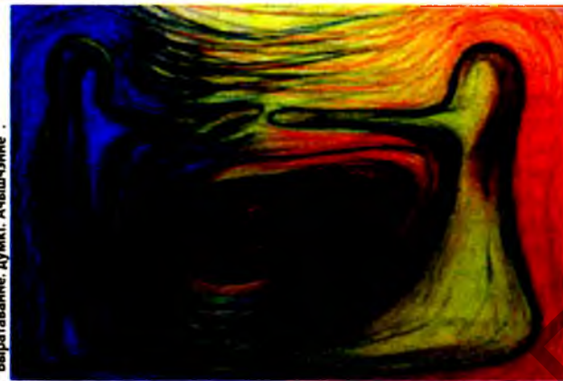
Надзея Хмельніцкая. Частка трыціку “Выраванне. Душкі. Ачышчэнне”.