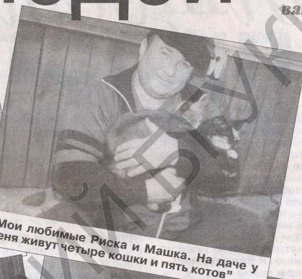
"Мои любимые Риска и Машка. На даче у меня живут четыре кошки и пять котов"