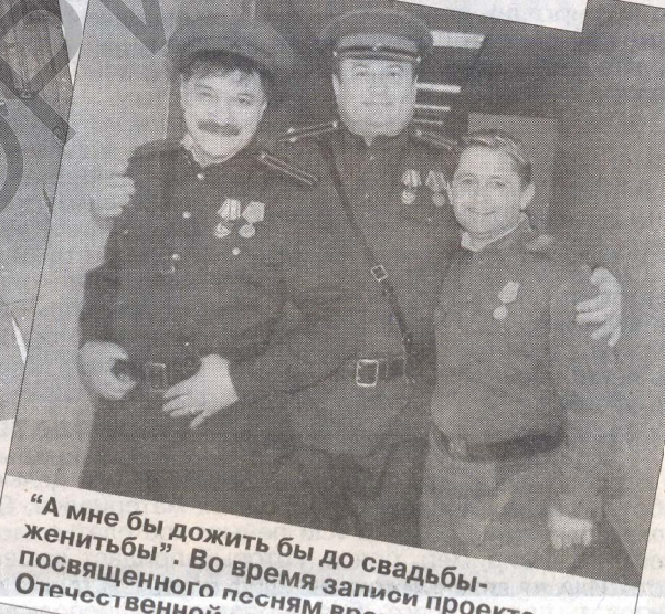
"А мне бы дожить бы до свадьбы-женитьбы". Во время записи проекта, посвященного песням времен Великой Отечественной войны