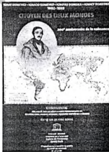
Вкладка выдання ЮНЕСКО «Грамадзянін двух сусветай», прысвечанага юбілейнай выставе пра І. Дамейку ў Парыжы (2002 г.)

«1. Не варта сёння марнаваць сілы нашага краю на эмігранце, на падарожжы без мэты, на рэвалюцыйныя