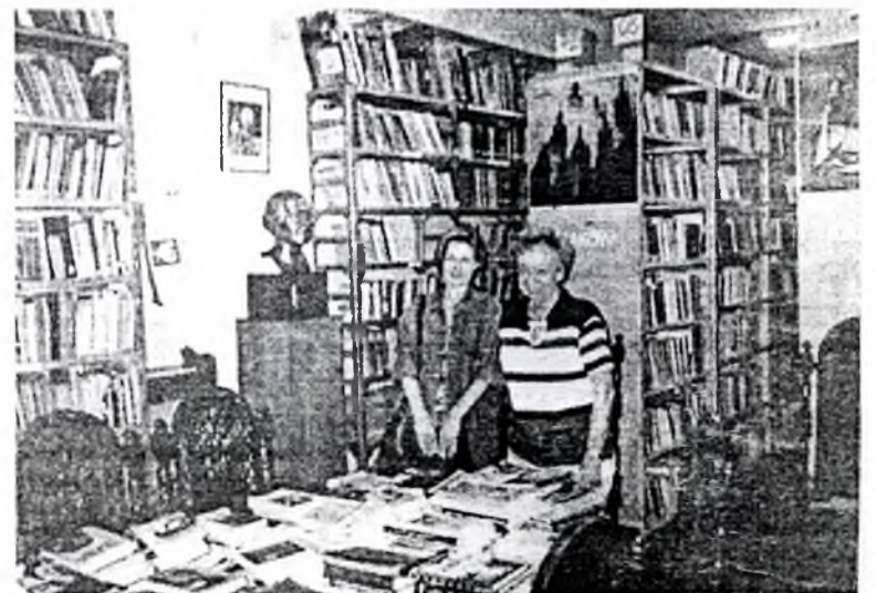
Бібліятэка імя І. Дамейкі ў Сант'яга дэ Чылі