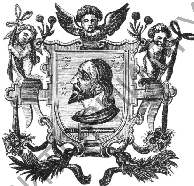
Герб г. Віцебска 1597 г.

У канцы другога перыяду (1563) спачатку Полацк і ўся ўсходняя частка Віцебскага княства (за выключэннем Віцебска) былі заваяваны Іванам Грозным. Віцебск пасля доўгай і ўпартай абароны быў узяты графам Шарамецевым у 1654 г., а ў 1667 г. у адпаведнасці з Андрусаўскім замірэннем адышоў да Рэчы Паспалітай. Унутранае грамадзянскае жыццё горада ў той час рэгулявалася “жалаванымі граматамі” на магдэбургскае права, якое давала мяшчанам асобны ўласны суд і права на самакіраванне. У гэты час Віцебску быў дадзены і герб горада.