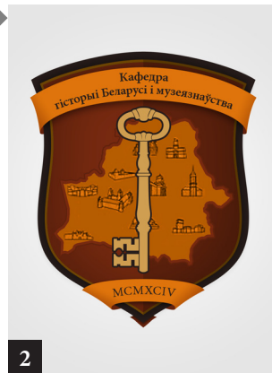
2. Герб кафедры гісторыі Беларусі і музеязнаўства