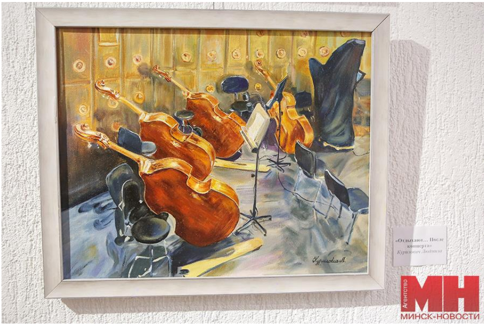
«Остатки... После концерта» Курашова Дарина