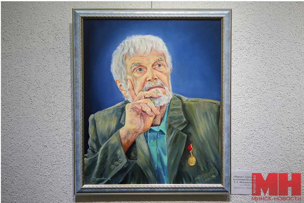
«Портрет народного артиста Беларуси Г. И. Волкова» С. Я. Козлов Академия искусств