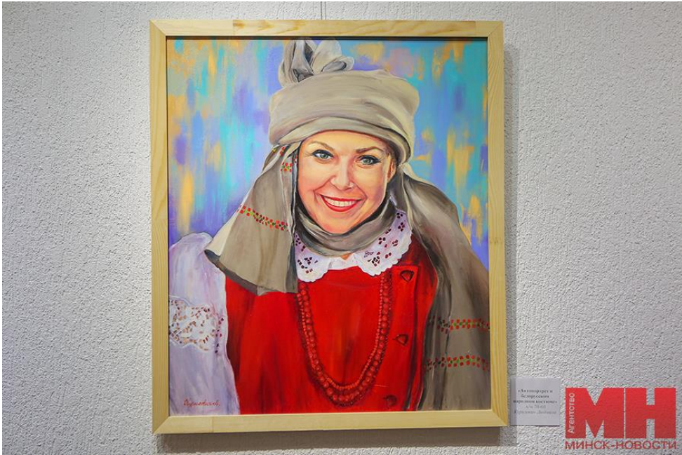
«Портрет народной артистки Республики Беларусь Г. И. Волковой» С. Я. Козлов Академия искусств