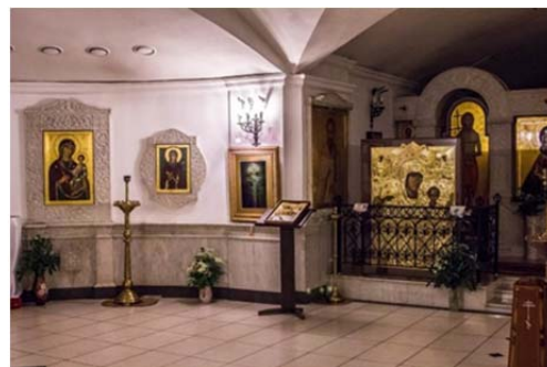
Фото 4. Храм Покрова Пресвятой Богородицы, где находятся художественные голограммы Жировичской иконы Божией Матери, Креста Евфросинии Полоцкой (справа)