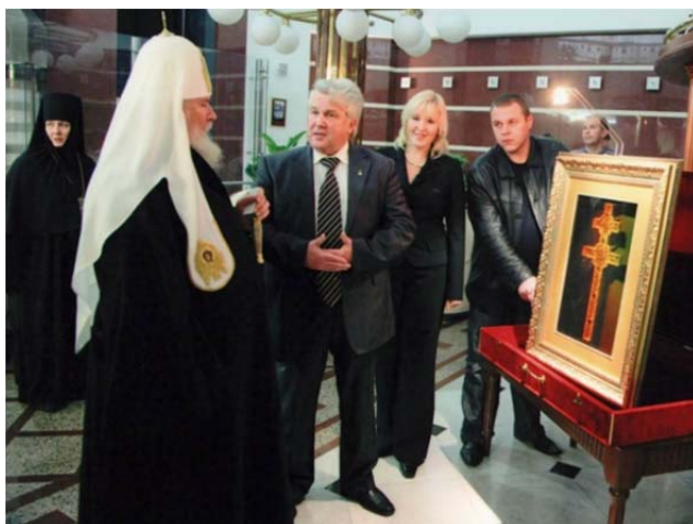
Фото 3. Патриарх Московский и всея Руси Алексей II благословляет коллектив предприятия «Магия света» на дальнейшие работы в области использования голографии для сохранения православных сокровищ

работы в области использования голографии для духовного возрождения нации (фото 3).