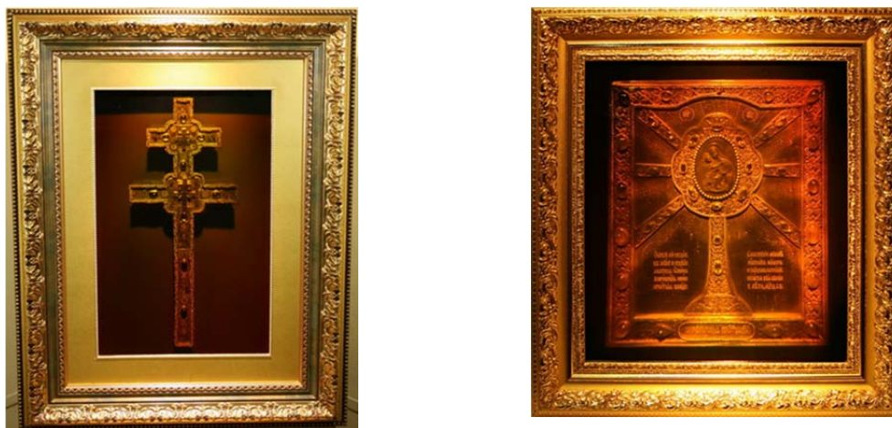
Фото 2. Внешний вид голограмм Креста Евфросинии Полоцкой (слева), Жировичской иконы Божией Матери (справа)