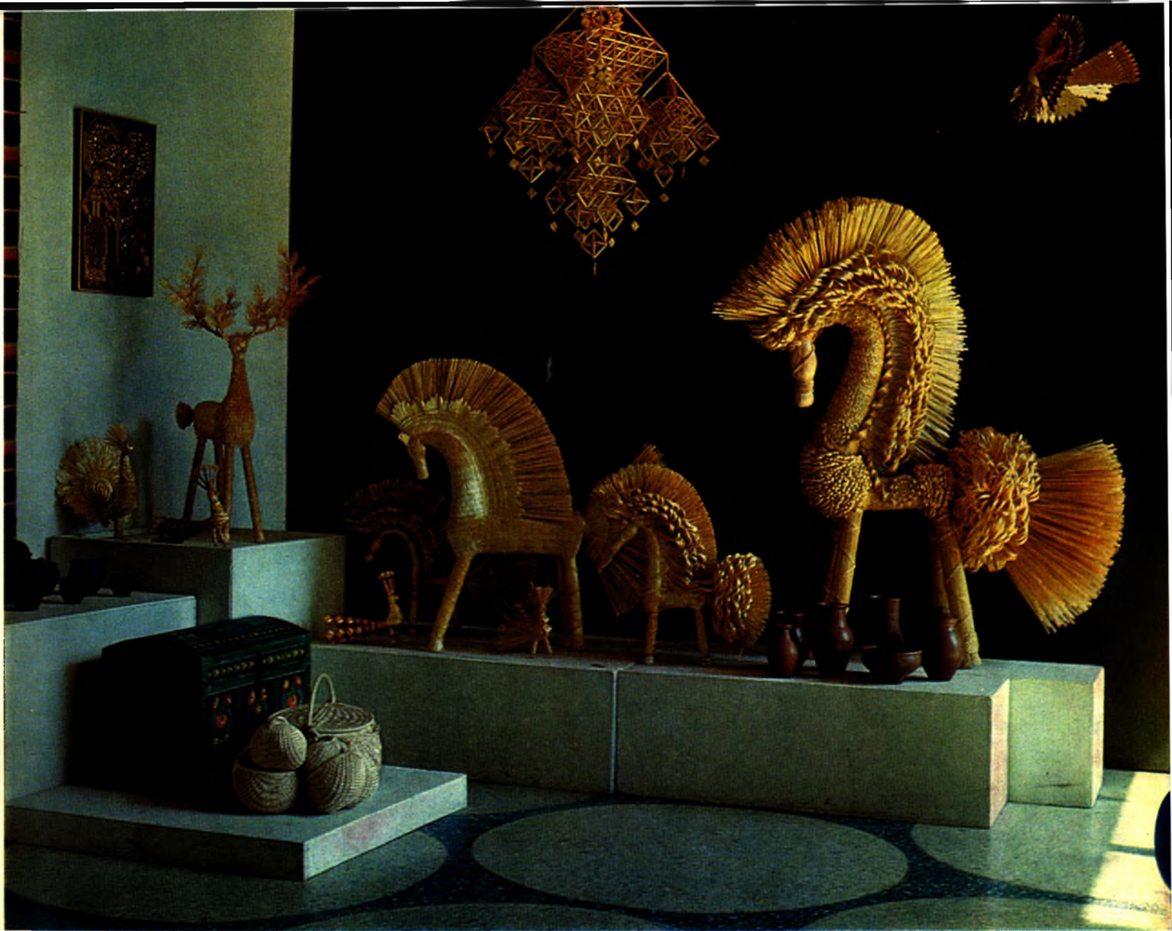
Фрагмент экспазіцыі аддзела народнага мастацтва на выстаўцы «Гармонія і асяроддзе». Мінск, 1986.