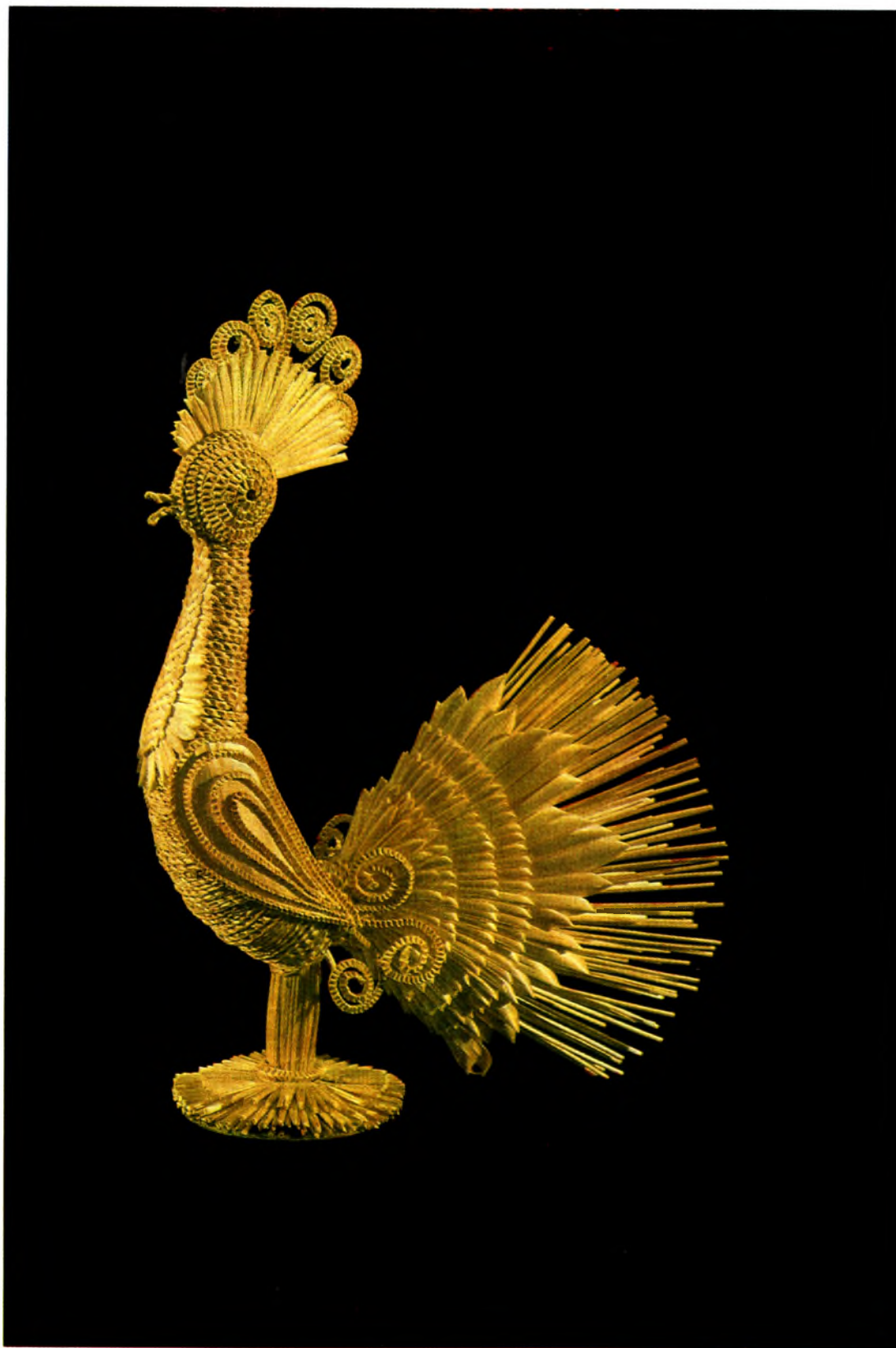
Л. Главацкая. Певень. Саломна, пляценне, 1987.

Развіццё сучаснага саломпляцення ў першую чаргу звязана з прадпрыемствамі мастацкіх прамыслаў. Сярод вырабаў з саломкі найперш вылучыліся нацыянальныя сувеніры, якія выяўляюць характар, густ беларускага народа, каларыт нашай рэспублікі. Сацыяльны заказ на сувеніры быў рэалізаваны да пачатку 1970-ых гадоў. Вырабы з саломкі пачалі выпускаць Брэсцкая фабрыка сувеніраў, Магілёўская, Хойніцкая і Чачэрская фабрыкі мастацкіх вырабаў. У продажы з'явіліся саламяныя лялькі «Беларуска», «Хлеб-соль» і іншыя сувеніры. Многія з іх пачалі экспартавацца за мяжу. Творчасць пачынальнікаў прамыслу В. Гаўрылюк і К. Арцёменка, папулярнасць новай сувенірнай прадукцыі далі магутны імпульс развіццю мастацтва саломпляцення.