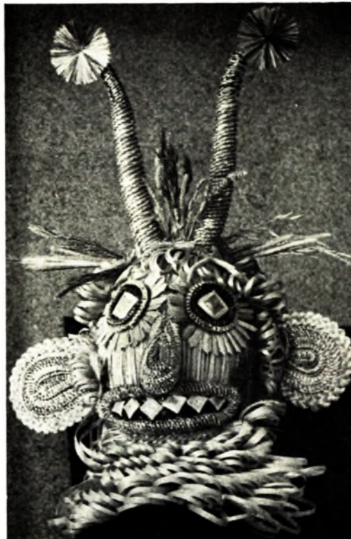
Т. Агафоненка. Дэкаратыўная мас-на «Чорт». Саломка, пляценне, 1987.

Разам з тым масавая прадукцыя промыслаў, пастаўленая на промысловы паток, паступова абязлічвалася і траціла свае эстэтычныя якасці. Сёння амаль перапыніўся яе экспарт. Арганізаваныя мастацкія промыслы аддалі свой прыярытэт майстрам Мастацкага фонду Саюза мастакоў БССР, якія працуюць індывідуальна.