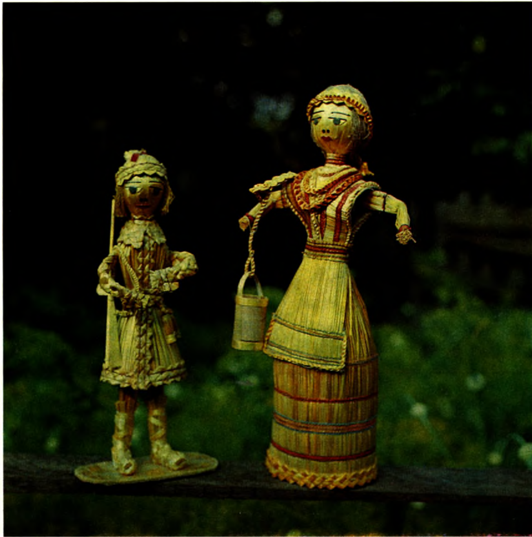
В. Гаўрылюк. Саламяная пластына, 1960-ыя гг.

выключна з сялянскай культурай. Яно ўяўляла сабою непасрэдны натуральны працяг асноўнага занятку земляроба — вырошчвання хлеба. Па сваёй сутнасці сялянскае саломапляценне — гэта складаны сінкрэтычны комплекс, звязаны з сялянскай працаю, абсталяваннем побыту, традыцыйнымі абрадамі, навакольным прыродным асяродкам, калектыўным мастацка-рамесным вопытам і эстэтычнымі ўяўленнямі.