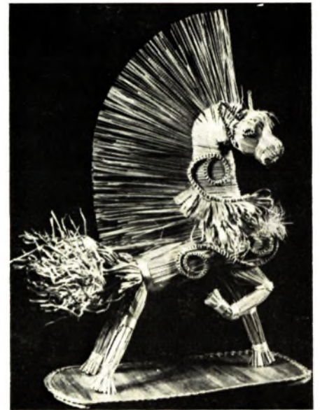
К. Арцёменка. Конь. Саломка, пляценне, 1970-ыя гг.

Народная эстэтыка саломкі, адухоўленая ідэяй урадлівасці, была чужая гарадской культуры. Таму