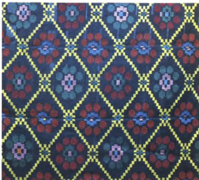
Мал. 961. Посцілка. 1960-я гг. Лён, бавоўна, воўна, аднабаковы перабор (в. Беразнякі, Жыткавіцкі раён)

раёнаў даматканя ткаціны ўжывалі для вырабу паўсядзённага адзення — сарочак, спадніц.