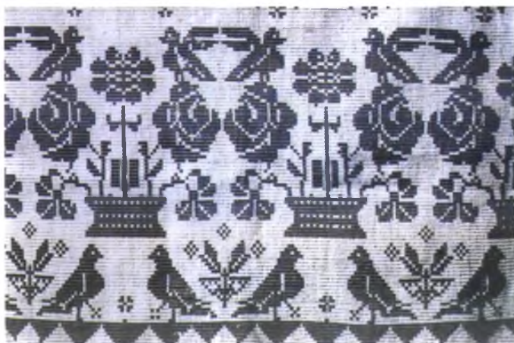
Мал. 1025. Посцілка-“перабіранка”. 1960-я гг. Лён, бавоўна, двухбаковы перабор (п. Пабедны, Лельчыцкі раён)

кі раён), “выкладанцы” (Лельчыцкі раён), “набіраная”, “накладаная”. Ткачыхі казалі пра гэтую тэхніку ткацтва: “Закладанне — як хочаш, так і закладай” (в. Залесе, Чачэрскі раён). У Петрыкаўскім раёне некаторыя ткачыхі ткалі пераборныя посцілкі адваротным бокам да сябе, каб не пакідаць на вонкавым баку разваротныя петлі.