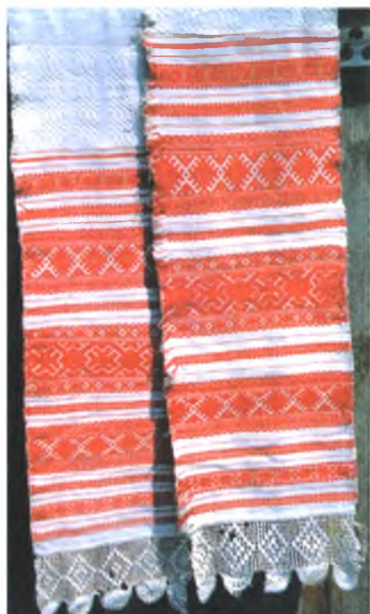
Мал. 965. Набожнік. Канец XIX ст. Лён, бавоўна, бранае ткацтва. 340 × 26 см. Марта Вежнавец, 1882 г.н. (в. Сапейкі, Акцябрскі раён)