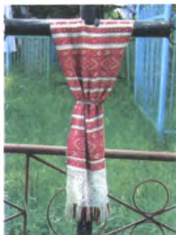
Мал. 1016. Надмагільны крыж з тканым ручніком на Радаўніцу (в. Здудзічы, Светлагорскі раён). 2010 г.

Ручнік суправаджае чалавека ў апошні шлях. Яго пакідаюць на надмагільным крыжы пасля пахавання. На Радаўніцу ў Светлагорскім і Акцябрскім раёнах на крыж вешаюць толькі палавіну бранага ручнікаў-“набожніка”. Ручнік разрэзваюць папалам, робяць у ім пасярэдзіне дзірку і надзяваюць зверху на крыж. Унізе ручнік падпяразваюць стужкай так, што атрымліваецца, нібы крыж апрануты ў сарочку, як чалавек. Падобна рабілі вопратку для немаўляці – “мятлік”. У сярэдзіне кавалка палатна прарэзвалі дзірку, надзявалі праз галаву на дзіця і перавязвалі яго паяском. Другую палавіну разрэзанага ручніка вешалі на крыж на наступны год на Радаўніцу (Веткаўскі, Светлагорскі раёны) (мал. 1015, 1016, 1017).