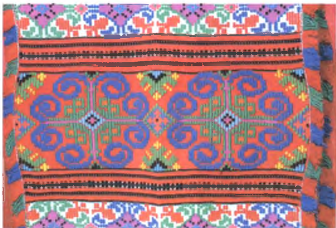
Мал. 995. Ручнік. Фрагмент. 1970-я гг. Бавоўна, пераборнае ткацтва (в. Неглюбка, Веткаўскі раён)

Кампазіцыя неглюбскага ручніка будзеца з сямі-дзесяці арнаментаваных палос, па-мясцоваму – “хрыстоў”. Яе цэнтр вызначаны шырокай паласой, у якой звычайна змешчаны два вялікія арнаментальныя элементы. Цэнтральная частка люстэркава абрамлена іншымі “хрыстамі”. Сярэднік доўгіх неглюбскіх ручнікоў звычайна ператыканы чырвонымі гладкімі ці дробнаарнаментаванымі палосамі.