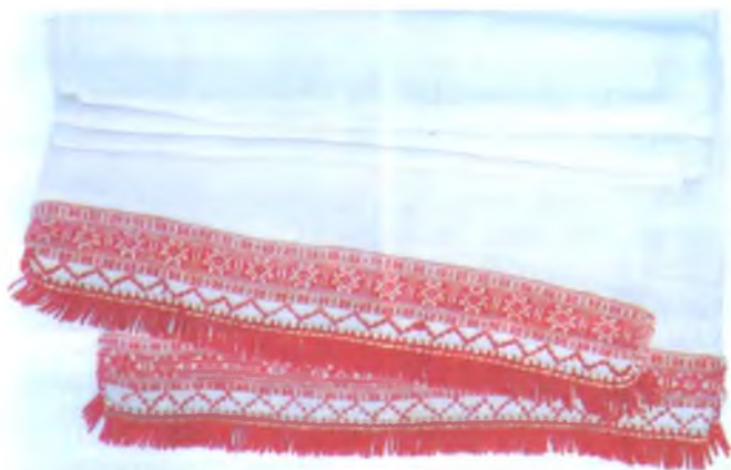
Мал. 1013. Намітка. Канец XIX ст. Лён, бавоўна, вышыўка крыжыкам. 340 × 40 см (в. Новыя Завалёны, Акцябрскі раён). Цэнтр гісторыі і культуры г.п. Акцябрск, кп 1129

Распаўсюджана было выкарыстанне ў пахавальных звычаях намітак (мал. 1013, 1014). “Наметкай” – дзвюма неразрэзанымі наміткамі абабівалі дамавіну па баках. Гэтая намітка ўяўляе сабой “завівала”, якім прынята было звязваць маладых (в. Залатуха, Калінкавіцкі раён). Наміткі, якія калісьці былі галаўнымі павязкамі замужніх жанчын, у другой палове ХХ ст. захоўвалі сярод рэчаў: “на смерць” “Намётка – блюдуць, каб абабіць дамавіну” (в. Акцяброва, Кармянскі раён). У в. Сінічына Буда-Кашалёўскага раёна паведамлілі, што наміткі, прызначаныя для пахавання, не ператыкалі краснымі ніткамі, г. зн. гэта было чыста белае палатно.