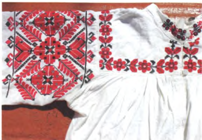
Мал. 1058. Сорочка жаночая на гестцы. 1940-я гг. Паркаль, вышыўка крыжыкам. Ніна Церашковіч, 1930 г. (в. Беразняякі, Жыткавіцкі раён)