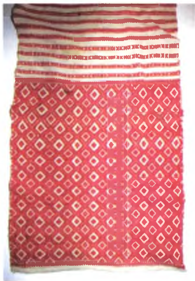
Мал. 978. Ручнік. Канец XIX ст. Лён, бавоўна, бранае ткацтва. ДГКУ "Гомельскі палацава-паркавы ансамбль", б/н