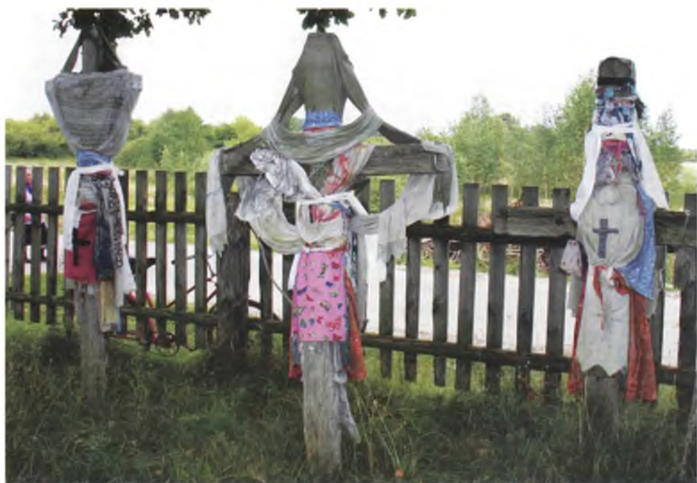
Мал. 1070. Аброчныя крыжы, якія ў 1930-я гг. перанеслі на могілкі з вёскі (в. Рычоў, Жыткавіцкі раён). 2007 г.