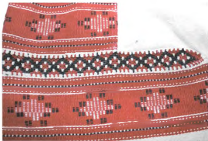
Мал. 952. Сарочка. Фрагмент паліка і рукава. Лён, бавоўна, пераборнае ткацтва, карункі іголкавыя. ДГКУ “Гомельскі палацава-паркавы ансамбль”

У канцы ХVІІІ і ў ХІХ ст. у Гомельскім Падняпроўі дзейнічала некалькі ткацкіх мануфактур. Князь Н.А. Румянцаў меў палатняную фабрыку ў сваім