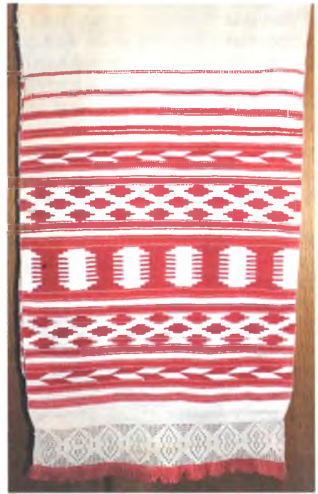
Мал. 973. Ручнік. Пачатак XX ст. Лён, бавоўна, закладное і шасцініговае ткацтва (в. Рыскаў, Рагачоўскі раён). ДГКУ “Гомельскі палацава-паркавы ансамбль”, кп 15545/1