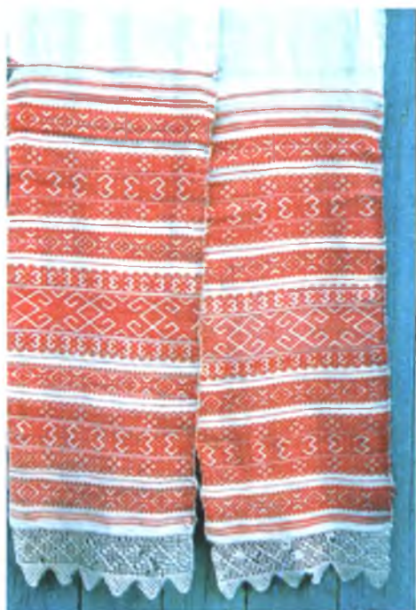
Мал. 964. Ручнік-“набожнік”. Канец XIX ст. Лён, бавоўна, бранае ткацтва. 300 × 28 см. Степаніда Папруга, 1885 г.н. (в. Маісееўка, Акцябрскі раён)