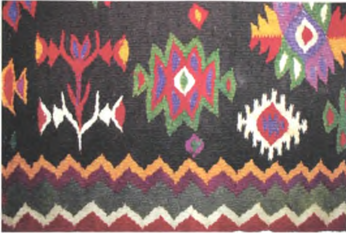
Мал. 945. Фартух-запаска. 1900 г. Воўна, лён, закладное ткацтва. 61 × 67 × 57 см (в. Мядзведнае, Ельскі раён). ДГКУ “Гомельскі палацава-паркавы ансамбль”, кп 14797

раінай Ельскім раёне ў традыцыйны строй жаночага адзення ўваходзіў фартух-запаска, выкананы па ўзору кілімаў у закладной тэхніцы (мал. 945).