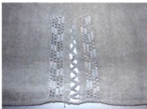
Мал. 1054. Сарочка жаночая. Фрагмент. Лён, расшыўка “саколкі” (г. Тураў, Жыткавішкі раён). ДГКУ “Гомельскі палацава-паркавы ансамбль”, кп 14981/1