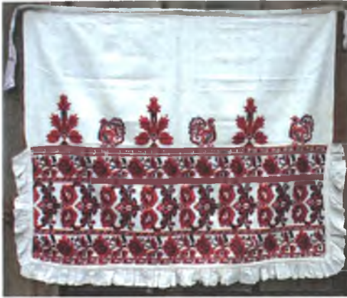
Мал. 1060. Фаргух. Пачатак XX ст. Паркаль, вышыўка крыжыкам (в. Пагост, Жыткавіцкі раён). Тураўскі краязнаўчы музей, кп 1679 пр 219