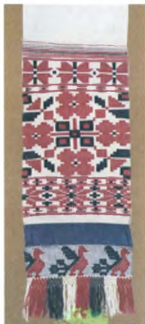
Мал. 983. Ручнік-“набожнік”. 1910-я гг. Бавоўна, аднабаковы перабор. 318 × 28 см (в. Баршчоўка, Добрушскі раён). Веткаўскі музей стараабрадніцтва і беларускіх традыцый імя Ф.Р. Шклярава, кп 316 /1.

Пераборныя канцы выкананы звычайна асобна і прышыты да палатніны ручніка. Сустракаюцца і суцэльныя ручнікі, якія маюць паласаты сярэднік, уздоўж ператыканы простымі чырвонымі і вузкімі арнаментаванымі чырвона-чорнымі шлячкамі. Усе вядомыя ўзоры ручнікоў цалкам выкананы з баваўняных нітак. Іх выраблялі на продаж. Пераборныя канцы ручнікоў выкарыстоўваліся нявестамі як вясельныя дары. Цэнтрам вытворчасці браных і пераборных ручнікоў у Добрушскім раёне, магчыма, былі вёскі Кузьмінчы і Церахоўка. Ручнікі гэтага тыпу распаўсюджаны на значнай тэрыторыі ў Добрушскім і ва ўсходняй частцы Веткаўскага раёна.