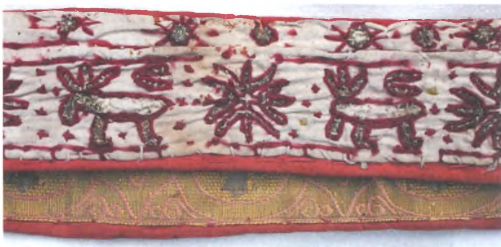
Мал. 1038. Пояс-“галёна” (адваротны бок). XIX ст. Лён, воўна, вышыўка, золотная нітка. Тураўскі краязнаўчы музей, кл 1040 пр 31