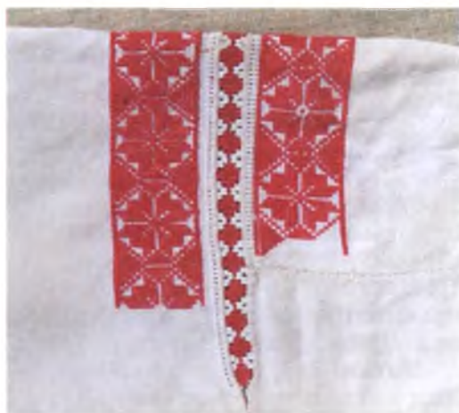
Мал. 1049. Сарочка жаночая. Фрагмент. Пачатак XX ст. Лён, вышыўка крыжыкам, злучальнае шво. Захоўваецца ў СДК в. Малыя Аўцюкі Калінкавіцкага раёна