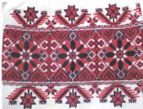
Мал. 1056. Сарочка жаночая. Фрагмент. Пачатак XX ст. Лён, вышыўка крыжыкам, злучальнае шво (в. Насовічы, Добрушскі раён). ДГКУ “Гомельскі палацава-паркавы ансамбль”, кп 14528/6

Вышыўка крыжыкам распаўсюджана па ўсёй Гомельшчыне і прадстаўлена рознымі мастацка-стылістычнымі варыянтамі, якія характэрны для пэўных лакальных тэрыторый. Гэтую тэхніку ў адпаведнасці з асаблівасцямі яе выканання па ліку нітак называлі “чысленка” (Калінкавіцкі раён), “чысленкай нашыта” (Чачэрскі раён). Вышыўка крыжыкам на прадметах адзення ў рэгіёне вылучаецца шчыльнасцю запаўнення вышываных бардзюраў арнамантам і дробным памерам крыжыка (на дзве ніткі). Гэта сведчыць аб тым, што іх вышывалі па ранейшых узорах вышыўкі наборам, пераводзілі старадаўнія арнаменты ў больш зручную і прадуктыўную ў выкананні тэхніку. Можна меркаваць, што Падняпроўе раней, чым іншыя рэгіёны Беларусі, успрыняло ў канцы XIX ст. гэтую вышывальную тэхніку. Дывановае запаў-