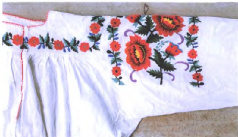
Мал. 1065. Сарочка на гестцы. 1960-я гг. Паркаль, акрыл, вышыўка гладзю (в. Данілевічы, Лельчыцкі раён)