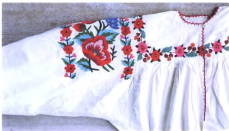
Мал. 1064. Сарочка на гестцы. 1960-я гг. Паркаль, акрыл, вышыўка гладдзю (в. Данілевічы, Лельчыцкі раён)

У 1960—1970-я гг. на вёску прыйшла новая хваля вышывальнай моды — вышыўка адвольнай каляровай гладдзю. Вышыўка выконваецца па папярэднім контуры і мае вялікія выяўленчыя магчымасці. Гэтая вышывальная тэхніка канчаткова выцесніла з народнай культуры традыцыі геаметрычнага арнаменту і бела-чырвоную гаму спалучэння колераў: “Сталі крыжыкам