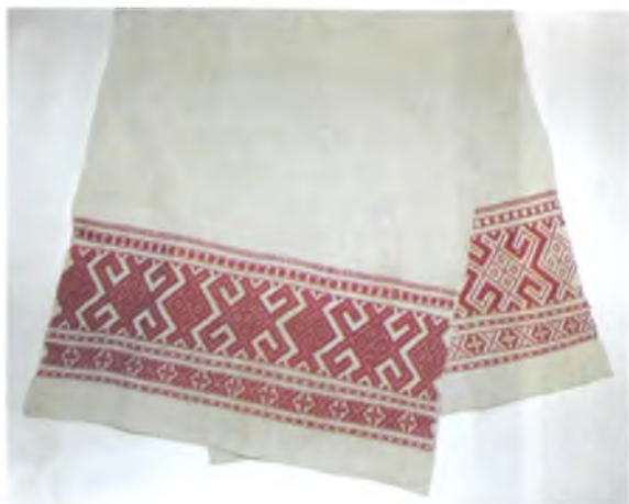
Мал. 1007. Ручнічок-“полотенце”. Лён, бавоўна, бранае ткацтва. 100 × 44 см (в. Маркавічы, Гомельскі раён). ДГКУ “Гомельскі палацава-паркавы ансамбль”, кп 15834/6