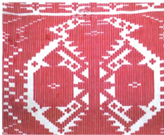
Мал. 988. Ручнік. Фрагмент. Бавоўна, аднабаковы перабор. ДГКУ “Гомельскі палацава-паркавы ансамбль”, б/н

Такі тып пераборнага ручніка заступіў месца браных ручнікоў, якія былі шырока распаўсюджаны ў канцы XIX — пачатку XX ст. на Пасожжы (Веткаўскі, Буда-Кашалёўскі раёны). Пераборныя ручнікі паўтараюць вертыкальныя кампазіцыі даўніх браных ручнікоў, у якіх геаметрычныя элементы размешчаны адзін над адным, злучаны паміж сабой па вертыкалі. Для пераборных ручнікоў характэрны таксама ўзбуйненыя сеткава-геаметрычныя арнаменты і паўнатуральныя