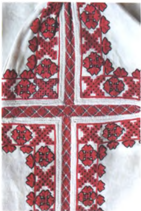
Мал. 1040. Жаночая сарочка. Фрагмент. Канец XIX ст. Лён, бавоўна, лікавая гладзь, крыж, злучальнае шво (в. Васільеўка, Добрушскі раён). Музей старажытнабеларускай культуры ІІЭФ ЦБКМЛ НАН Беларусі