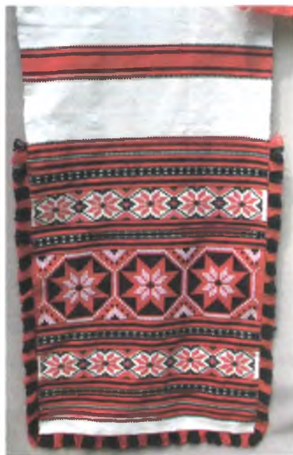
Мал. 993. Ручнік. Фрагмент. 1970-я гг. Бавоўна, пераборнае ткацтва (в. Неглюбка, Веткаўскі раён)

акрылу. Даўжыня ручнікоў павялічылася з трох да пяці і нават сямі метраў (мал. 992, 993, 994, 995).