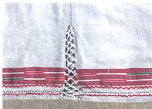
Мал. 1055. Сарочка жаночая. Фрагмент. 1930-я гг. Лён, вышыўка, закладное ткацтва, злучальнае шво (в. Луткі, Столінскі раён, Брэсцкая вобл.). Мазырскі аб’яднаны кразнаўчы музей, кп 5283 р – 1796

Вышыўка крыжыкам распаўсюджана па ўсёй Гомельшчыне і прадстаўлена рознымі мастацка-стылістычнымі варыянтамі, якія характэрны для пэўных лакальных тэрыторый. Гэтую тэхніку ў адпаведнасці з асаблівасцямі яе выканання па ліку нітак называлі “чысленка” (Калінкавіцкі раён), “чысленкай нашыта” (Чачэрскі раён). Вышыўка крыжыкам на прадметах адзення ў рэгіёне вылучаецца шчыльнасцю запаўнення вышываных бардзюраў арнамантам і дробным памерам крыжыка (на дзве ніткі). Гэта сведчыць аб тым, што іх вышывалі па ранейшых узорах вышыўкі наборам, пераводзілі старадаўнія арнаменты ў больш зручную і прадуктыўную ў выкананні тэхніку. Можна меркаваць, што Падняпроўе раней, чым іншыя рэгіёны Беларусі, успрыняло ў канцы XIX ст. гэтую вышывальную тэхніку. Дывановае запаў-