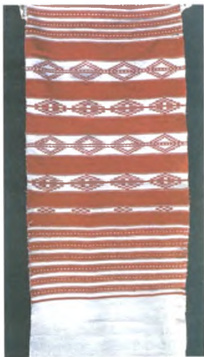
Мал. 990. Ручнік. Пачатак XX ст. Лён, бавоўна, бранае ткацтва (в. Палессе, Чачэрскі раён)