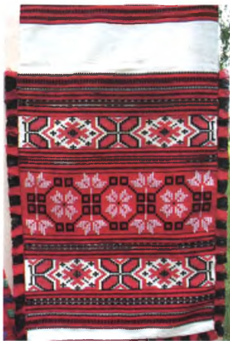
Мал. 957. Ручнік. 1950-я гг. Лён, бавоўна, пераборнае ткацтва (в. Неглюбка, Веткаўскі раён)

У в. Навінкі Калінкавіцкага раёна з пражы хатняга вырабу ткалі палатно і шарсцяную тканіну для вырабу пахавальнага адзення: сарочак і андаракоў, бо на той час яшчэ захоўвалася традыцыя хаваць жанчын у традыцыйным строі. Для гэтага шылі як асобныя часткі строю, якіх не хапала, так і строі цалкам. У вёсках Жыткавіцкага, Лельчыцкага, Петрыкаўскага, Акцябрскага