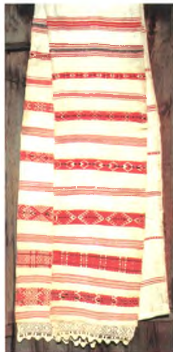
Мал. 970. Ручнік. Пачатак XX ст. Лён, бранае ткацтва, 36 × 570 см. Тураўскі краязнаўчы музей, кп 1608 пр 161