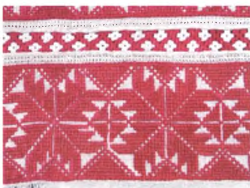
Мал. 1057. Сарочка жаночая. Фрагмент. Пачатак XX ст. Лён, вышыўка крыжыкам, злучальнае шво. Захоўваецца ў СДК в. Маля Аўцюкі Калінкавіцкага раёна