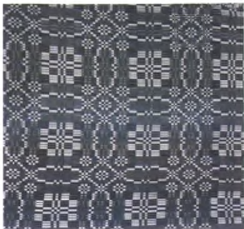
Мал. 1024. Посцілка. 1970-я гг. Бавоўна (падчэрнена дубовай карой і праварана ў шалупінні цыбулі), чатырохнітовае ткацтва “на палачку” і “на калёсах”. Анастасія Юрчак, 1932 г.н. (в. Валосавічы, Акцябрскі раён)

кі раён), “выкладанцы” (Лельчыцкі раён), “набіраная”, “накладаная”. Ткачыхі казалі пра гэтую тэхніку ткацтва: “Закладанне — як хочаш, так і закладай” (в. Залесе, Чачэрскі раён). У Петрыкаўскім раёне некаторыя ткачыхі ткалі пераборныя посцілкі адваротным бокам да сябе, каб не пакідаць на вонкавым баку разваротныя петлі.