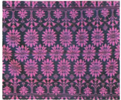
Мал. 1027. Посцілка. Фрагмент. 1960-я гг. Лён, воўна, двухбаковы перабор. Ганна Фядосік, 1914 г.н. (в. Лучыцы, Петрыкаўскі раён)

Для аднабаковых посцілак Гомельшчыны характэрны сеткавыя кампазіцыі двух відаў: дыяганальныя сеткі і шасцігранныя соты. Сеткі шчыльна запоўнены кветкавымі разеткамі, ромбамі, васьміканцовымі зоркамі. Шчыльнасць і разнаколернае вырашэнне ўзорных элементаў стварае ўражанне мазаічнасці (мал. 1028, 1029, 1030, 1031). Часам фон посцілкі вакол фігур у межах ячэйкі сеткі цалкам перакрыты ўзорным утком, што надае большую колеравую насычанасць і дэкаратыўнасць. Асобную групу складаюць посцілкі з дывановымі цэнтрычнымі кампазіцыямі (мал. 1032).