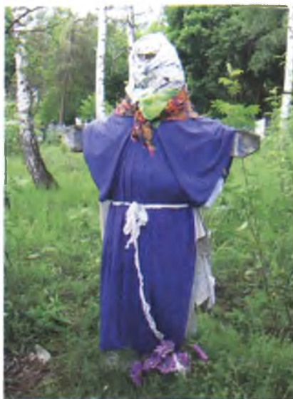
Мал. 1071. Аброчны крыж на могілках. Да 1957 г. знаходзіўся на рагу вуліц у в. Ляскавічы Акцябрскага раёна. 2007 г.

лі: “аб дзень наткалі”, “адным днём рабілі”. Калектыўны збор жанчын для выканання гэтай працы называлі “талака”: “Абракнуліся людзі зделать талаку, будзённік выткалі” (в. Рудня Насімкавіцкая, Чачэрскі раён).