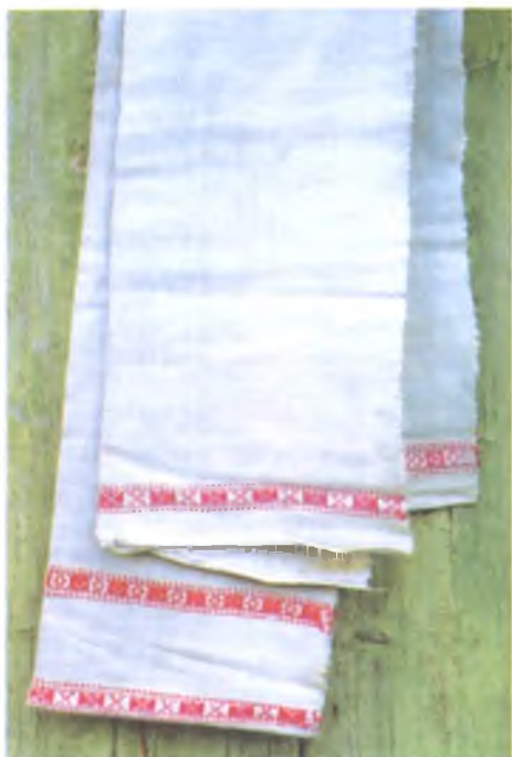
Мал. 1009. Намітка. Пачатак XX ст. Лён, бранае ткацтва. 430 × 46 см (в. Залатуха, Калінкавіцкі раён)