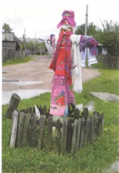
Мал. 1079. Аброчны крыж на скрыжаванні ў в. Тонеж Лельчыцкага раёна. 2007 г.