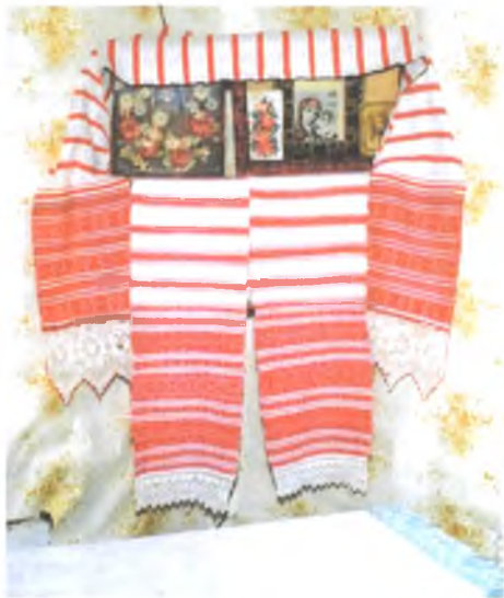
Мал. 996. Кут з набожнікамі ў хаце Ганны Міцкевіч, 1910 г.н. (в. Мармавічы, Светлагорскі раён). 2005 г.

У Жлобінскім раёне ручнікі для абразоў называюць “ручнік на Бога” (в. Кіцін). У Буда-Кашалёўскім і Светлагорскім раёнах для тканых і вы-