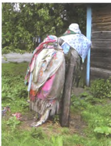
Мал. 1077. Аброчныя крыжы на скрыжаванні ў в. Дзяржынск Лельчыцкага раёна. 2007 г.