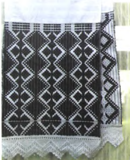
Мал. 986. Ручнік. Пачатак XX ст. Лён, бавоўна, бранае ткацтва (в. Івольск, Буда-Кашалёўскі раён)