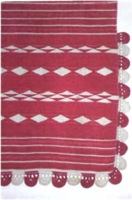
Мал. 943. Фартух. 1910 г. Лён, бавоўна, закладное ткацтва, карункі, вязаныя кручком. 76 × 93 см (в. Нісімкавічы, Чачэрскі раён). ДГКУ “Гомельскі палацава-паркавы ансамбль”, кп 15377/2

ўзораў, якія былі запісаны ў сярэдзіне 1980-х гг.: “у персценькі”, “у воспачкі”, “балонкі”, “шыбкі”, “шыбкі з балонкамі”, “дарогамі”, “крэстамі”, “чаркі табунамі”, “горкі з балонкамі”, “каўбухамі”, “быч’і вочы” 1 . У Калінкавіцкім раёне ажурпадобныя і фактурныя тканіны для абрусаў з узорамі “морам”, “маразамі”, “жабкамі”, “перстнікамі”, “у кругі” выраблялі з дапамогай дошчачак да 1940–1950-х гг.