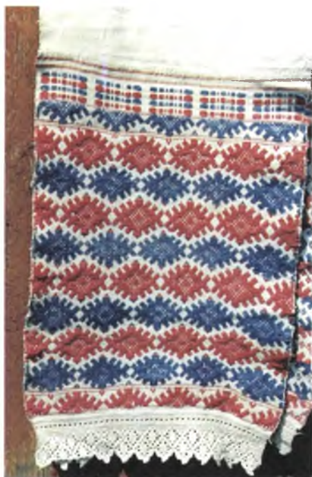
Мал. 985. Ручнік-“набожнік”. Канец XIX ст. Лён, бавоўна, выбарнае ткацтва (в. Патапаўка, Буда-Кашалёўскі раён). Са збору В.А. Лабачэўскай