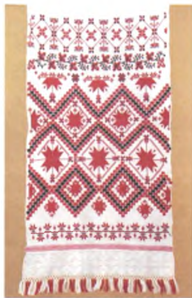
Мал. 1043. Ручнік. Пачатак XX ст. Лён, вышыўка лікавай гладзю, крыжыкам. 276 × 50 см (Рагачоўскі раён). Нацыянальны гістарычны музей Беларусі, кп 40966/112