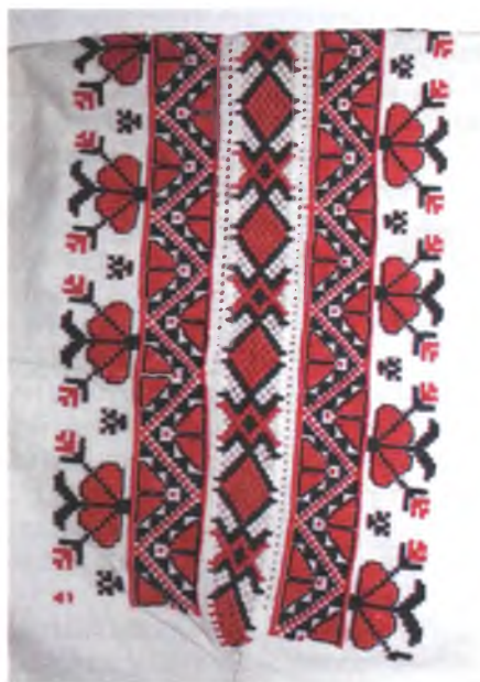
Мал. 1048. Сарочка. Фрагмент. Пачатак XX ст. Лён, вышыўка крыжыкам, злучальнае шво (в. Насавічы, Добрушскі раён). ДГКУ “Гомельскі палацава-паркавы ансамбль”, кп 14528