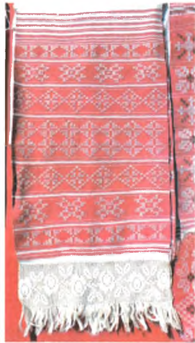
Мал. 954. Ручнік. 1910-я гг. Лён, бавоўна, пераборнае ткацтва (в. Колбаўка, Веткаўскі раён). Веткаўскі музей стараабрадніцтва і беларускіх традыцый імя Ф.Р. Шклярава, кп 330 /2

гомельскім маёнтку, на якую ў 1806 г. запарасіў замежных майстроў. На яго палатнянай фабрыцы ў в. Прудок Беліцкага паведа ў 1812 г. працавала 63 ткацкіх станка і 115 прыгонных сялян. У 1813—1826 гг. тут выраблялі тонкае льяное палатно рознага гатунку “на манер галандскіх”, цік, абрусы і сурвэткі, у тым ліку камчатые, мухаяр і хусткі. Узорныя абрусы, сурвэткі, ручнікі, “каніфасы” ткалі на ткацкай мануфактуры князя Румянцава ў Добрушскім фальварку, якая існавала з 1775 па 1831 г. 1 , на Кузьмінскай палатнянай мануфактуры (в. Кузьмінічы Добрушкага раёна), дзе працавалі прыгонныя сяляне.