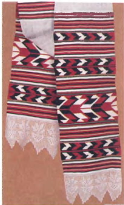
Мал. 971. Ручнік. Канец XIX ст. Лён, бавоўна, закладное ткацтва. 284 × 25 см (в. Калыбань, Брагінскі раён). Музей старажытнабеларускай культуры ІІЭФ ЦБКМЛ НАН Беларусі, гч 39.

На сумежнай тэрыторыі Украіны падобныя па кампазіцыі, арнаменце і тэхніцы выканання ручнікі носяць назву “кілімавыя ручнікі”. На фарміраванне гэтай з’явы паўплывала ткацтва кілімаў, тэхніка якіх была прынесена з Усходу. У XVII–XVIII стст. ва Украіне і на памежных беларускіх землях існавала шмат мануфактур і майстэрняў, якія выраблялі кілімы. Тэхніка іх вырабу і арнаментыка былі выкарыстаны ў сялянскім ткацтве для стварэння традыцыйных ручнікоў-“набожнікаў”.