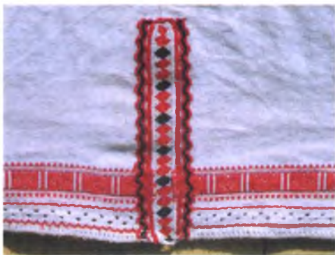
Мал. 1052. Сарочка мужчынская. Пачатак XX ст. Лён, вышыўка, мярэжка, злучальнае шво (Калінкавіцкі раён). Мазырскі аб'яднаны краязнаўчы музей, нв 4432/1

Жаночыя сарочкі Жыткавіцкага, Лельчыцкага раёнаў і суседняй Століншчыны адметныя аздабленнем прыполаў ажурнымі расшыўкамі і мярэжкамі, якія выконваліся па пракладзеных паміж полкамі ніцях асновы. Як і ў неглюбскім строі, на Тураўшчыне аздаблення браным ці закладным узорам, нашываннем і расшыўкамі прыполы сарочак прынята было дэманстраваць з-пад панёвы ці андарака. У дзявочых і вясельных сарочках прыгажосць і якасць выканання аздаблення прыполаў сведчыла аб рукадзельных здольнасцях іх стваральніцы, таму асаблівую ролю яны адыгрывалі ў вясельнай абраднасці (мал. 1054, 1055).