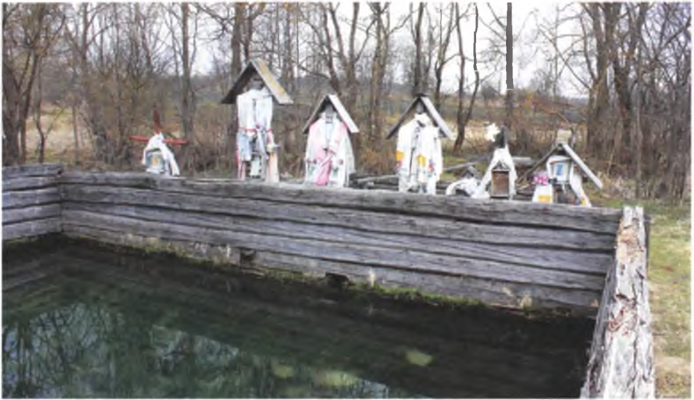
Мал. 1073. Святая крыніца з аброчнымі крыжамі ў в. Будзішча Чачэрскага раёна. 2010 г.