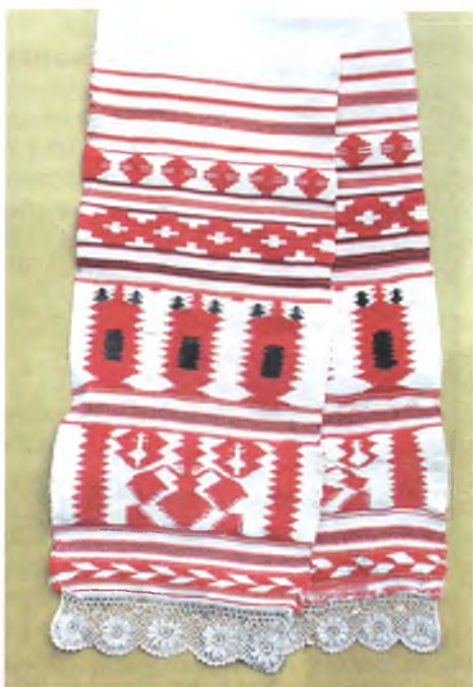
Мал. 974. Ручнік. Пачатак XX ст. Лён, бавоўна, закладное і шасцінітовае ткацтва (в. Хізава, Кармянскі раён). Са збору В.А. Лабачэўскай