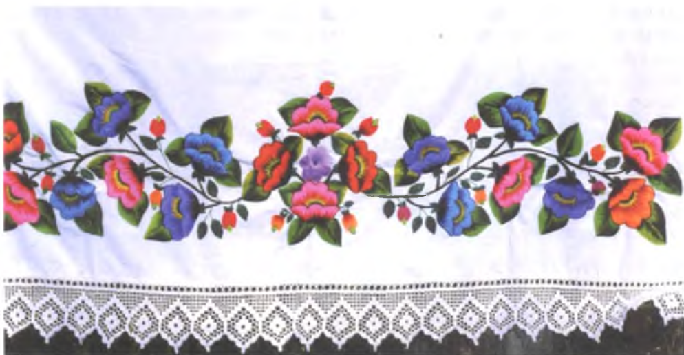
Мал. 1066. Падузорнік. 1990-я гг. Паркаль, вышыўка гладзю. Ева Цалко, 1951 г.н. (в. Жмурнае, Лельчыцкі раён)

Паліхромная вышыўка гладзю зрабілася асноўнай у аздабленні сарочак, фартухоў, хустак там, дзе яшчэ стваралі і насілі самаробныя строі адпаведна мясцовым традыцыям. У Жыткавіцкімі і Лельчыцкім раёнах у гэты час сфарміраваўся нават сучасны варыянт турава-мазырскага строю, які выконваўся з куплёных тканін і яскрава аздабляўся паліхромнай вышыўкай (мал. 1064, 1065).