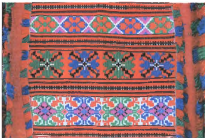
Мал. 994. Ручнік. Фрагмент. 1970-я гг. Бавоўна, пераборнае ткацтва (в. Неглюбка, Веткаўскі раён)