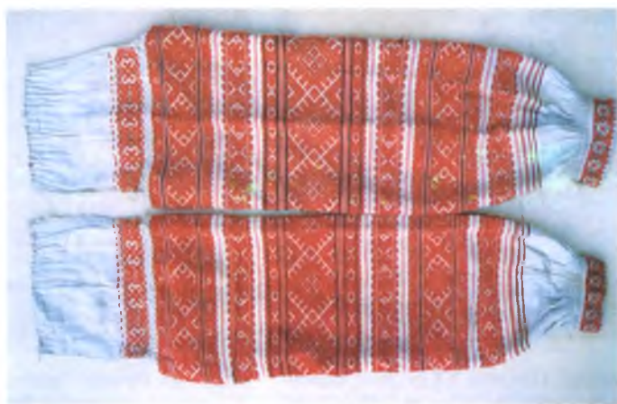
Мал. 966. Рукавы сарочкі. Канец XIX ст. Лён, бавоўна, бранае ткацтва (в. Маісееўка, Акцябрскі раён)