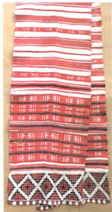
Мал. 967. Ручнік. Пачатак ХХ ст. Лён, баваўна, бранае ткацтва (в. Акцяброва, Кармянскі раён). Са збору В.А. Лабачэўскай

На тэрыторыі Калінкавіцкага раёна вылучаюцца два тыпы браных ручнікоў. Ручнікі, што лакалізаваны ў паўднёвай частцы раёна — у вёсках Вялікія і Малыя Аўцюкі, Залатуха, адрозніваюцца тым, што шырокія чырвоныя палосы рэпсавага ткацтва чаргуюцца ў іх з дробнаўзорнымі палоскамі, якія складаюцца з простых матываў арнаменту “куль” і “перавёрнуты куль”. Сустракаюцца ручнікі цалкам чырвона-паласатыя. У в. Вялікія Аўцюкі па-