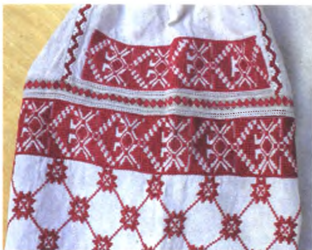
Мал. 1047. Сарочка жаночая. Фрагмент. Пачатак XX ст. Лён, вышыўка крыжыкам, злучальнае шво (в. Боруск, Калінкавіцкі раён). Калінкавіцкі дзяржаўны краязнаўчы музей, кп 280 в 131