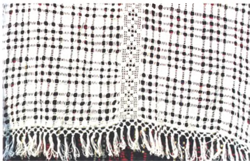
Мал. 942. Настольнік. Фрагмент. 1946 г. Лён, ажурнае ткацтва (в. Есіпава Рудня, Калінкавіцкі раён)