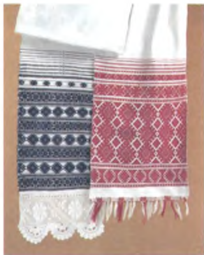
Мал. 980. Ручнікі. Канец XIX – пачатак XX ст. Бавоўна, бранае ткацтва. 237 × 28, 237 × 32 см (набыты ў в. Старая Беліца Гомельскага раёна і в. Юркавічы Веткаўскага раёна). Музей старажытнабеларускай культуры ПЭФ ЦБКМЛ НАН Беларусі, кп 2422 т 1265. Веткаўскі музей стараабрадніцтва і беларускіх традыцый імя Ф.Р. Шклярава, кп 716.

Гомельскія ручнікі вызначаюцца высокай якасцю выканання, тонкасцю і шчыльнасцю тканіны. Большасць з іх выткана з бавоўны. У аснове больш даўніх ручнікоў – лён. Шырыня ручнікоў – ад 28–30 да 33–38 см, даўжыня складае 240–290 см. Значнай даўжынёй браных канцоў, манументальнасцю, паласатым сярэднікам, складанай разбудовай кампазіцыі і бездакорнай якасцю выканання вылучаюцца ручнікі з в. Раманавічы, што побач з Гомелем. Іх даўжыня дасягае 350 см пры шырыні палатніны 32–36 см. Сустракаюцца руч-