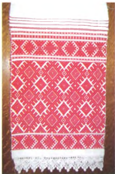
Мал. 976. Ручнік. Канец XIX ст. Лён, бавоўна, бранае ткацтва. Этнаграфічны музей сярэдняй школы в. Маркавічы Гомельскага раёна.