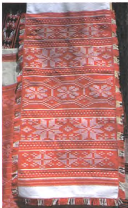
Мал. 955. Ручнік. 1950-я гг. Лён, ба- воўна, пераборнае ткацтва (в. Не- глюбка, Веткаўскі раён)

У сучасных тканінах выкарыстоўваецца два віда перабору: двухбаковы і аднабаковы. У другой палове XX ст. у тэхніцы пераборнага ткацтва на Гомельшчыне выраблялі пераважна паліхромныя поцілкі. Плённа развіваліся традыцыі аднабаковага пераборнага ткацтва да 1980-х гг. у в. Неглюбка Веткаўскага раёна, дзе ткалі знакамітыя дэкаратыўныя неглюбскія ручнікі