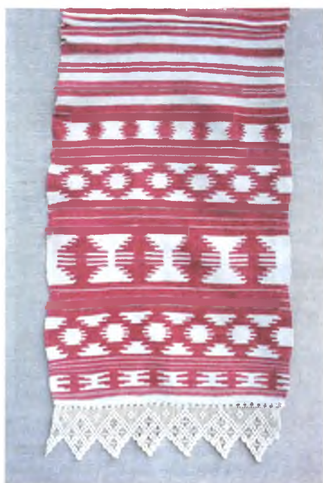
Мал. 975. Ручнік. Канец XIX ст. Лён, бавоўна, закладное ткацтва. Шырыня 38 см. Мазырскі аб'яднаны краязнаўчы музей, кп 3328/7

лянскім асяроддзі з дапамогай больш простаў у выкананні тэхнікі закладнога ткацтва.