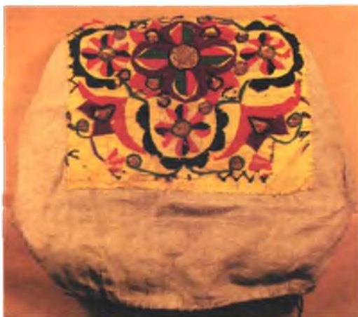
Мал. 1037. Галаўны ўбор (“пухоўка” з чапцом). XIX ст. Лён, каленкор, гарус, мішура, вышыўка гладдзю і “ў прыкрэп” (Тураўшчына). Музей антрапалогіі і этнаграфіі (Кунсткамера) імя Пятра Вялікага Інстытута антрапалогіі і этнаграфіі РАН, № 415 – 7 а

раў вышыўкі можна меркаваць па ўзору пояса-“галёны”, што ў XIX ст. уваходзіў у склад строю мяшчанак Турава (мал. 1038). Даўняя налобная павязка з галаўнога ўбору з вышыўкай, якая мае досыць архаічны ўзор у выглядзе аленяў і зорак, выкананы чырвоным гарусам і залацістай мішурой у тэхніцы “ў прыкрэп”, была ўжыта ў якасці падкладкі на адваротным баку пояса. Гэтыя музейныя экспанаты сведчаць аб існаванні ў XVII–XIX стст. на гістарычных землях Тураўшчыны (Жыткавіцкі раён Гомельскай вобласці, Столінскі раён Брэсцкай вобласці) у асяроддзі мяшчан Турава і Давыд-Гарадка і сялян навакольных вёсак своеасаблівай вышывальнай традыцыі, адметнай наборам салярных, кветкавых і іншых арнаментальных матываў, іх рознакаляровым вырашэннем з ужываннем нітак, што паступалі сюды з тэрыторыі Украіны 1 .