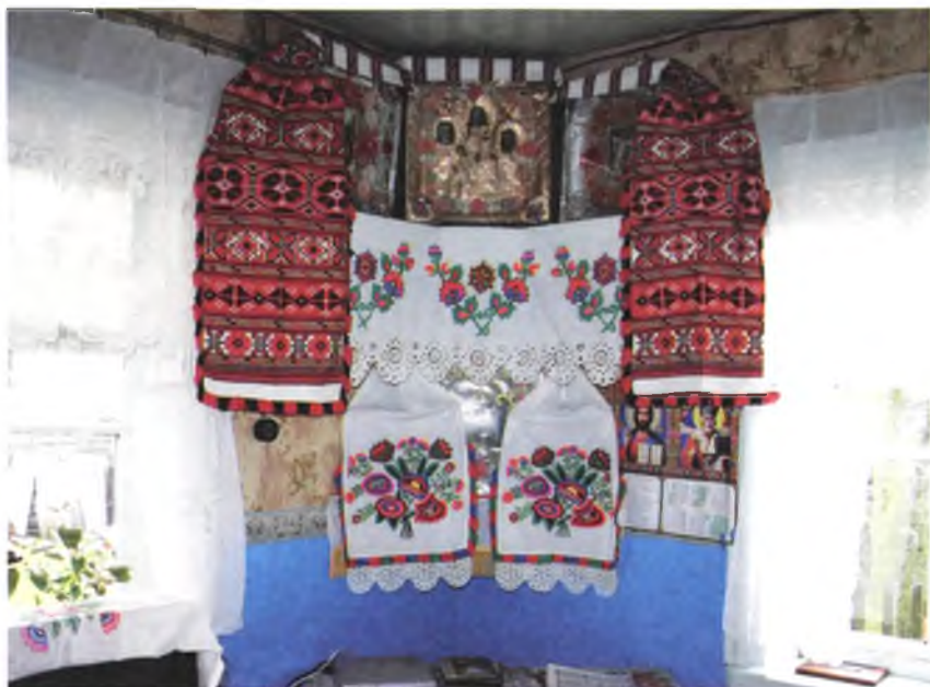
Мал. 1000. Інтэр'ер кухні ў хаце Ульяны Петрашэнка, 1938 г.н. (в. Неглюбка, Веткаўскі раён). 2010 г.