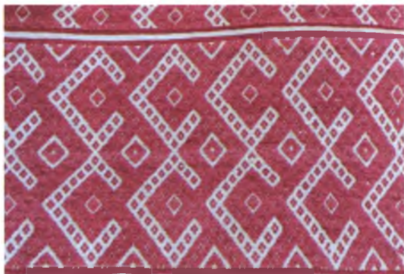
Мал. 979. Ручнік. Фрагмент. Пачатак XX ст. Лён, бавоўна, бранае ткацтва. 284 × 38,5 см (в. Антонаўка, Веткаўскі раён). Веткаўскі музей стараабрадніцтва і беларускіх традыцый імя Ф.Р. Шклярава, кп 227