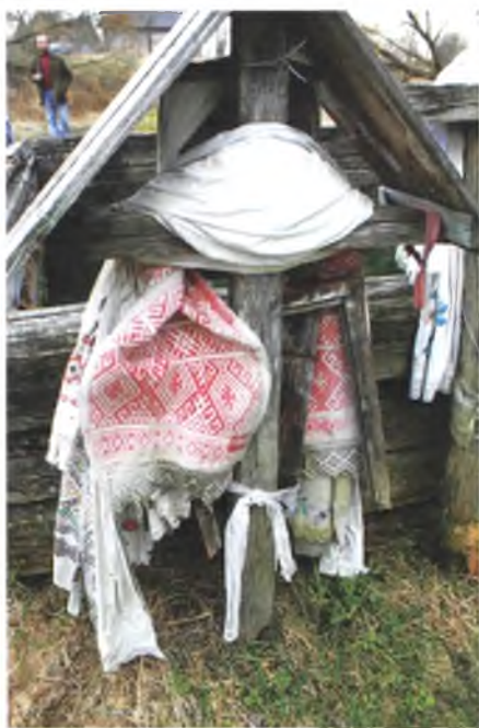
Мал. 1074. Аброчныя крыжы з ручнікамі каля святой крыніцы ў в. Будзішча Чачэрскага раёна. 2010 г.

Крыжы у в. Тонеж Лельчыцкага раёна цалкам закрытыя тканінамі – ручнікамі сваёй работы і крамнымі, нават сучаснымі махровымі ўціральнікамі кітайскай вытворчасці, хусткамі, фартухамі. Аброкі вешаюць на Вялікдзень. Жанчыны кажуць, што за раз начэпляваюць столькі, што “не дадзержывае крест” (мал. 1079).