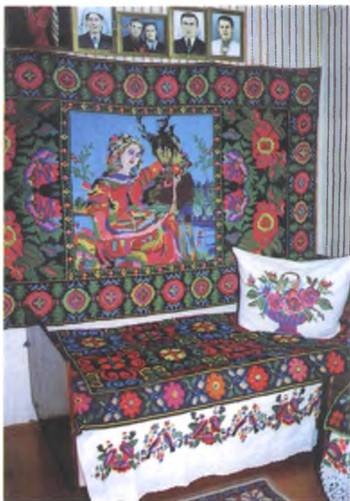
Мал. 1035. Пакой з тканымі дыванамі. 1980-я гг. Бавоўна, воўна, мулінэ, аднабаковы перабор. Алена Баннік, 1929 г.н. (в. Шчадрын, Жлобінскі раён)

З 1970-х гг. аднабаковыя паліхромныя посцілкі займаюць асноўнае месца ў інтэр’еры сельскага дома. Імі засцілаюць ложка, як дываны развешваюць па сценах. Буйная паліхромія посцілак і дываноў, узмоцненая ўжываннем акрылавых нітак, расквеціла ў гэты час сціплую прастору вясковага жылога інтэр’ера (мал. 1036).