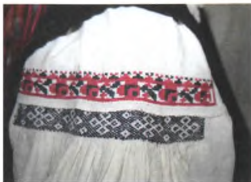
Мал. 1046. Сарочка жаночая. Фрагмент. Канец XIX ст. Лён, бавоўна, злучальнае шво, вышыўка па зборках і крыжыкам (Буда-Кашалёўскі раён)