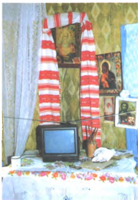
Мал. 999. Кут з набожнікам у хаце Варвары Маскаленка, 1924 г.н. (в. Вялікія Аўшюкі, Калінкавіцкі раён). 2005 г.

шываных ручнікоў, якія вешалі ў куце, прынята назва “платок”: “Платок – ручнік на ікону, запалаччу натыкалі” (в. Мыслаў Рог, Светлагорскі раён); “Платок – гэта набожнік счытаўся”. Назва “платок” паходзіць ад старажытнарускага слова “плат”. Ручнік называлі “платком”, магчыма, таму, што ім абгортвалі абраз і злучалі канцы ўнізе падобна таму, як жанчына павязвае хустку: накладае на лоб і завязвае пад барадой.