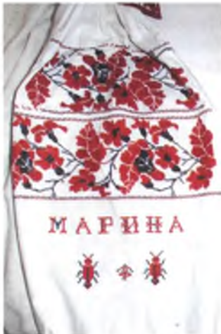
Мал. 1062. Сарочка жаночая. Фрагмент. Пачатак XX ст. Паркаль, вышыўка крыжыкам (г. Тураў, Жыткавіцкі раён). ДГКУ “Гомельскі палацава-паркавы ансамбль”, кп 14981/1