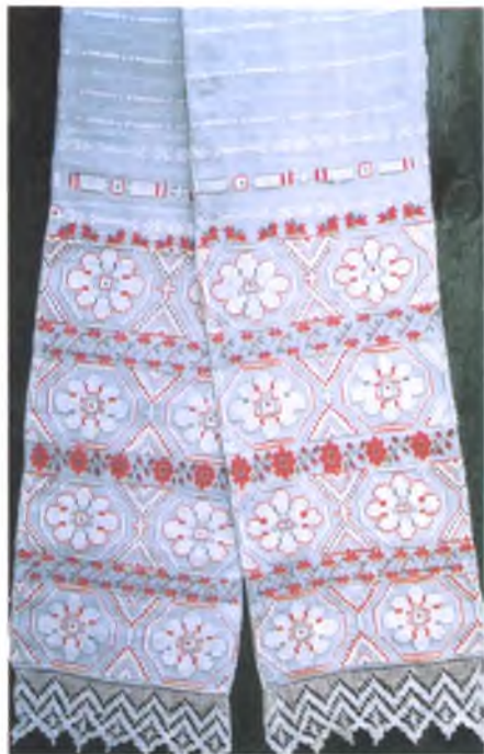
Мал. 949. Ручнік. Пачатак XX ст. Лён, бавоўна, аднабаковы перабор, вышыўка. 290 × 32 см (в. Здудзічы, Светлагорскі раён)