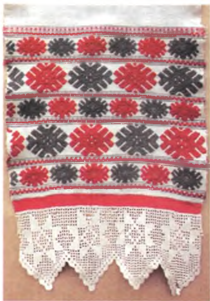
Мал. 941. Ручнік. Канец XIX ст. Лён, бавоўна, бранае і выбарнае ткацтва (Добрушскі раён). Са збору В.А. Лабачэўскай

У Петрыкаўскім, Жыткавіцкім, Лельчыцкім, Ельскім раёнах ажурападобныя тканіны мелі досыць прастыя малюнак з палосак, нескладаных элементаў, размешчаных у шахматным парадку. Фактурныя тканіны Чачэрскага раёна вылучаюцца багаццем арнаменту і яго разнастайнасцю. Аб гэтым сведчаць і назвы