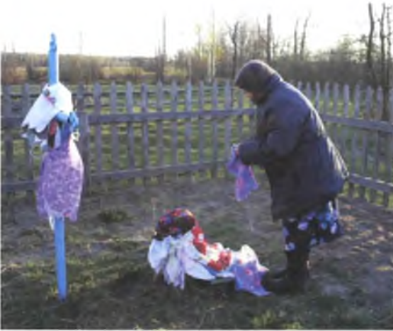
Мал. 1081. Жанчына з аброчным фартушком каля аброчнага крыжа “каменная дзевачка” раницай на Вялікдзень (в. Данілевічы, Лельчыцкі раён). 2009 г.