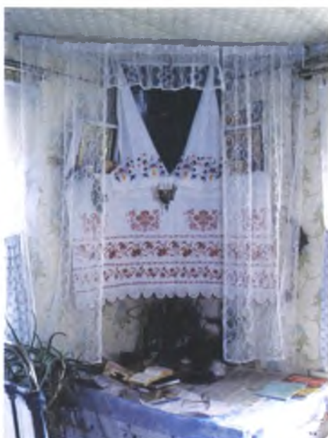
Мал. 1004. Кут з ручніком, накутнікам і фіранкай-“завескай” у хаце Ганны Лаў- рэнавай, 1935 г.н. (в. Будзішча, Чачэрскі раён). 2003 г.