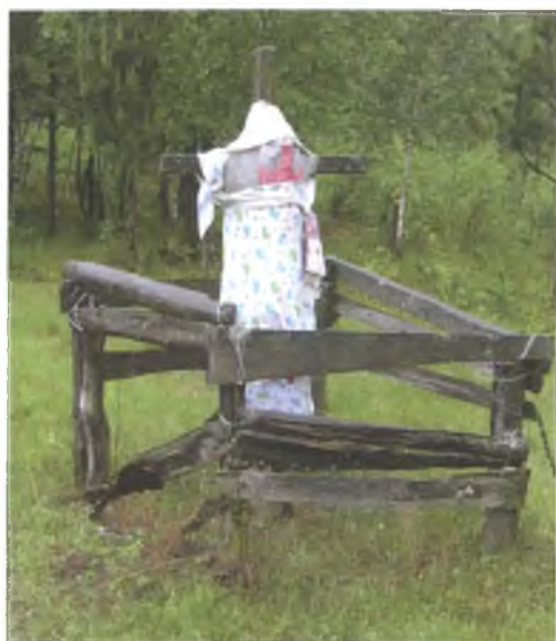
Мал. 1076. Аброчны крыж ў канцы в. Мілашавічы Лельчыцкага раёна. 2007 г.