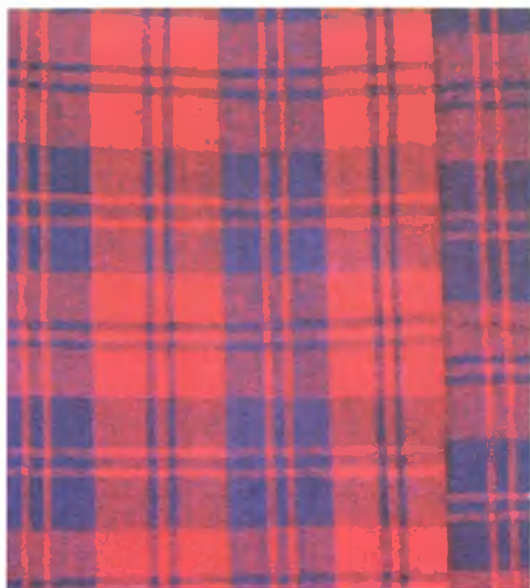
Мал. 1021. Посцілка. Фрагмент. 1940-я гг. Воўна, чатырохнітовае ткацтва “ў ряды”, “у касічку” (в. Цешкаў, Нараўлянскі раён)