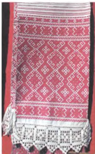
Мал. 938. Ручнік. Канец XIX ст. Лён, бавоўна, бранае ткацтва (в. Прыбыткі, Добрушскі раён). Веткаўскі музей стараабрадніцтва і беларускіх традыцый імя Ф.Р. Шклярава, кп 1037/2