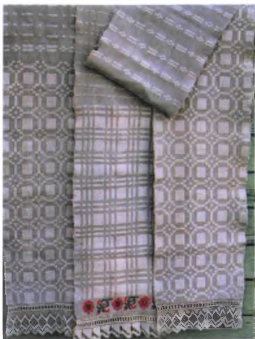
Мал. 948. Ручнікі. Пачатак XX ст. Лён, бавоўна, перабор. 300 × 27, 180 × 28, 250 × 28 см. Марыя Папруга, 1886 г.н. Зберагла гэтыя ручнікі, знаходзячыся ў каншлагеры ў в. Азарычы Калінкавіцкага раёна (в. Маісеёўка, Акцябрскі раён)

На трох нітах ткалі паўшарсцяныя тканіны для андаракоў. На пяці нітах выраблялі настольнікі. На шасці нітах атрымлівалі фактурнае перапляценне, якое называлі “кружкі”. Такія тканіны выкарыстоўвалі для летніх ільняных спадніц, у Неглюбскім і Веткаўскім раёнах – для вырабу вонкавай часткі рукавоў жаночых сарочак.