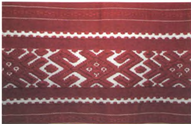
Мал. 991. Ручнік. Фрагмент. Пачатак XX ст. Бавоўна, бранае ткацтва (в. Неглюбка, Веткаўскі раён). Веткаўскі музей стараабрадніцтва і беларускіх традыцый імя Ф.Р. Шклярава