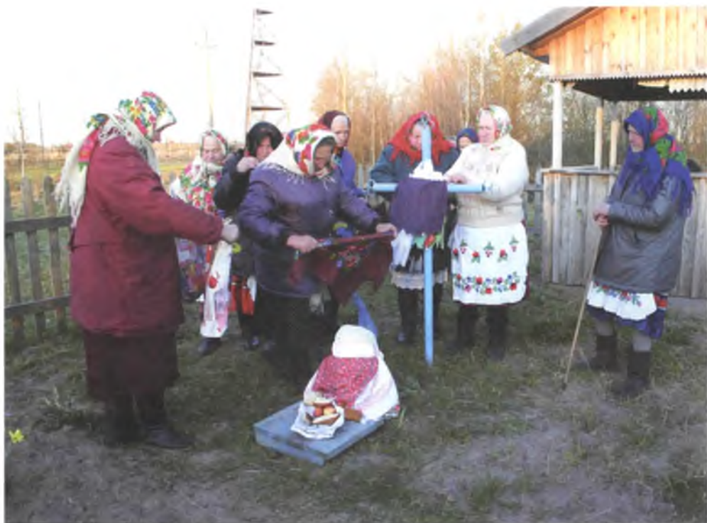
Мал. 1080. Жанчыны з аброкамі каля аброчнага крыжа “каменная дзевачка” раніцай на Вялікдзень (в. Данілевічы, Лельчыцкі раён). 2009 г.

У в. Данілевічы Лельчыцкага раёна раніцай на Вялікдзень жанчыны па ходу сонца абыходзяць усе драўляныя крыжы ў вёсцы і на кожны вешаюць свой аброк – спецыяльна для гэтага зробленыя фартушкі з тканіны – “фартусікі”. Потым яны нясуць аброкі на каменны антрапаморфны крыж, які называюць “каменная дзевачка”, “камень”, “святы камень” (мал. 1080, 1081). З сакральным каменем звязана паданне пра дзяўчынку, якая была праклятая сваёй маці 1 . Каля в. Баравая Лельчыцкага раёна ў лесе ёсць падобны аброчны каменны крыж, які таксама называюць “каменная дзевачка”. Да яго на Вялікдзень па традыцыі прыносяць аброкі – фартушкі, хусткі (мал. 1082).