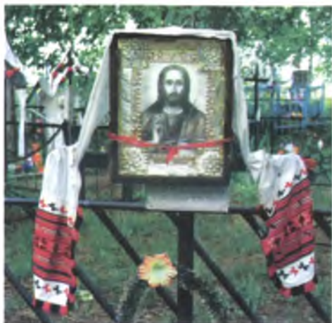
Мал. 1015. Надмагільны крыж з ручніком на Радаўніцу (в. Неглюбка, Веткаўскі раён). 2005 г.