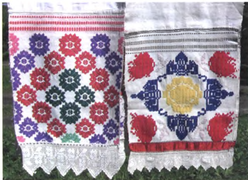
Мал. 987. Ручнікі. Пачатак XX ст. Лён, бавоўна, воўна, бранае ткацтва. Свята-Мікалаеўская царква в. Івольск Буда-Кашалёўскага раёна