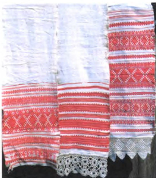
Мал. 962. Набожнікі. Пачатак XX ст. Лён, бавоўна, бранае ткацтва. 340 × 26, 215 × 26, 215 × 25 см. Марта Вэжнавец, 1882 г.н. (в. Сапейкі, Акцябрскі раён)

Кампазіцыі ручнікоў складаюцца са шчыльна спалучаных паміж сабой разнастайных па арнаменце браных барджораў. Цэнтральныя барджоры з буйных элементаў – ромбаў розных малюнкаў – фланкіруюцца вузейшымі палоскамі ромба-геаметрычнага арнаменту. На канцах ручніка, як правіла, размешчаны тры барджоры, якія кампазіцыйна спалучаюцца прамежкавымі вузкімі барджорамі. Паміж элементаў кампазіцыі барджораў пакінуты невялікія палосы белага фону. У цэлым кампазіцыі канцоў ручнікоў выглядаюць як суцэльнае ўзорачча (мал. 964, 965). Дробнафестончатае завяршэнне кожнага ўзорнага радка надае бранаму арнаменту багацце і вытанчанасць. У арнаментцыі ручнікоў ужываюцца разнастайныя выявы ромбаў – ад простых