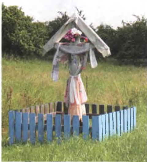
Мал. 1069. Аброчны крыж у канцы в. Перароў Жыткавіцкага раёна. 2009 г.

Для вызначэння тканін, якія выраблялі падчас абыдзённага рытуалу, на Гомельшчыне ўжывалі розныя назвы: “абдзённік”, “абудзёнаўка”, “абудзённік”, “абыдзённае палатно”, “будзённік”, “дзённік”, “дняўнік”, “аброчнік”, “аброк” “аброчны ручнік”, “ручнік”, “намітка”, “завеска”, “завіска”, “стамесачка”, “браднік”. Пра выраб рытуальнай тканіны каза-