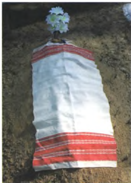
Мал. 1019. Настольнік на магіле на Радаўніцу (в. Будзішча, Чачэрскі раён). 2010 г.