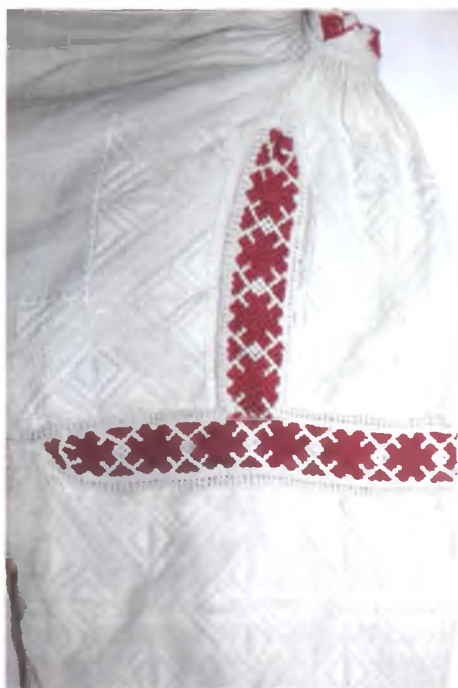
Мал. 1041. Жаночая сарочка. Фрагмент. Пачатак XX ст. Лён, бавоўна, вышыўка лікавай гладзю, злучальнае шво (в. Неглюбка, Веткаўскі раён). ДГКУ "Гомельскі палацава-паркавы ансамбль", кп 16414/1

Вышыўка наборам на Гомельшчыне сустракаецца не вельмі часта і саступае месца арнаментальнай традыцыйнай тканінаваму ткацтву. Яе можна бачыць на самых даўніх узорах адзення XIX ст., якія захоўваюцца ў Расійскім музеі этнаграфіі. У Добрушскім раёне вышыўка наборам дробнаўзорчатая, чырвоныя ніткі суцэльна запаўняюць фон, на якім тонкім графічным узорам чытаецца абрыс ромбаў, ромбаў з крыжамі і парасткамі – "крюкі" 1 (мал. 1044).