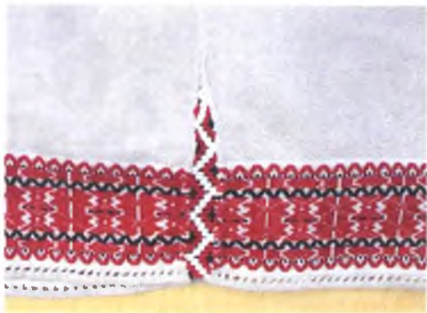
Мал. 1050. Сарочка жаночая. Фрагмент прыполу. Пачатак XX ст. Лён, бранае ткацтва, злучальнае шво, вышыўка лікавай гладзю, крыжыкам, мярэжка (в. Палессе, Светлагорскі раён)