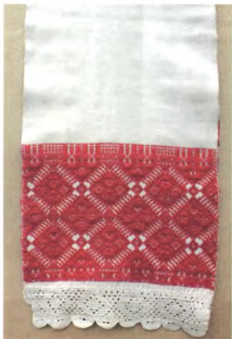
Мал. 984. Ручнік. Пачатак XX ст. Лён, бавоўна, бранае ткацтва (в. Ясакор, Буда-Кашалёўскі раён). Са збору В.А. Лабачэўскай

Арнаментальная кампазіцыя ручнікоў адпавядае традыцыям браных ручнікоў Гомельскага Падняпроўя. Іх аснову стварае рамбічная сетка з вертыкальным прынцыпам спалучэння элементаў. Для арнаментыкі ручнікоў характэрны разнастайныя элементы: ромбы, ромбы з розным запаўненнем унутры (ромбы адзін у адным; ромбы, падзеленыя касым крыжам на чатыры малыя ромбы; ромбы з чатырма кропкамі), ромбы з парэсткамі, ромбы з кручкамі (чатырма і больш), прамавугольнікі. Гэта дазваляе вызначыць бу-