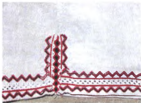
Мал. 1051. Сарочка мужчынская. Фрагмент прыполу. Лён, бранае ткацтва, вышыўка крыжыкам, злучальнае шво (Калінкавіцкі раён). Калінкавіцкі дзяржаўны краязнаўчы музей, кп 295 в 146

лінкавіцкага і Рагачоўскага раёнаў, і багата арнаментаваная злучальныя швы насцілам на сарочках в. Неглюбка Веткаўскага раёна (мал. 1052, 1053).