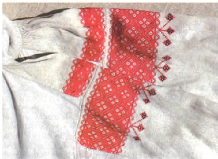
Мал. 1044. Сарочка жаночая. Фрагмент. Пачатак XX ст. Лён, бавоўна, вышыўка наборам. Мазырскі аб'яднаны крэязнаўчы музей, кп 2730 р – 411