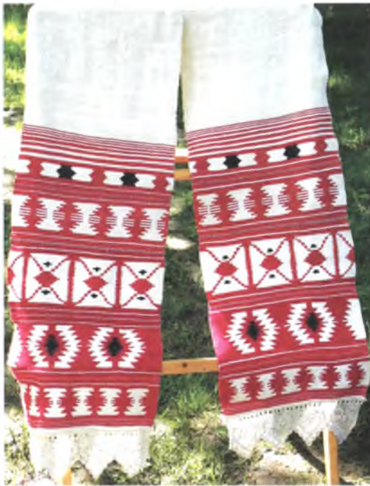
Мал. 972. Ручнік. Пачатак XX ст. Лён, бавоўна, закладное ткацтва

Мастацка-тэхналагічныя асаблівасці рагачоўскіх ручнікоў склаліся пад уплывам ткацтва кілімаў, пашыранага на тэрыторыі Украіны ў XVIII – першай палове XIX ст., і кралявецкіх ручнікоў, якія ў пачатку XIX ст. вырабляліся ў майстэрнях саматужнага ткацкага цэнтра ў Краляўцы на Чарнігаўшчыне. На рагачоўскіх ручніках прысутнічаюць характэрныя для кралявецкіх ручнікоў арнаментальныя матывы: двухгаловы арлол, стылізаваная дрэва, дрэва-свяцільнік. Гэтыя матывы запазычваліся і адаптаваліся ў ся-