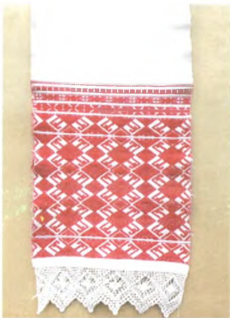
Мал. 981. Ручнік. Пачатак XX ст. Бавоўна, бранае ткацтва (в. Губічы, Буда-Кашалёўскі раён). Са збору В.А. Лабачэўскай

Другі тып кампазіцыі бранага ўзору добрушскіх браных ручнікоў — некалькі асобных бардзюраў ромба-геаметрычнага арнаменту з невялікімі прабеламі фону паміж імі (мал. 981, 982).