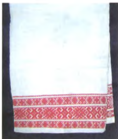
Мал. 1008. Ручнічок абрадавага прызначэння. Канец XIX ст. Лён, бавоўна, бранае ткацтва. Этнаграфічны музей сярэдняй школы в. Маркавічы Гомельскага раёна.

там. Ручнічок называўся “крылатка”, “крыласцік” (в. Шырокае, Залессе) (мал. 1007, 1008). “Наметкай” абгортвалі дзіця адразу пасля нараджэння (в. Сапейкі, Акцябрскі раён), наміткай на хрэсьбінах абдорвалі куму (в. Зеляночы, Калінкавіцкі раён).