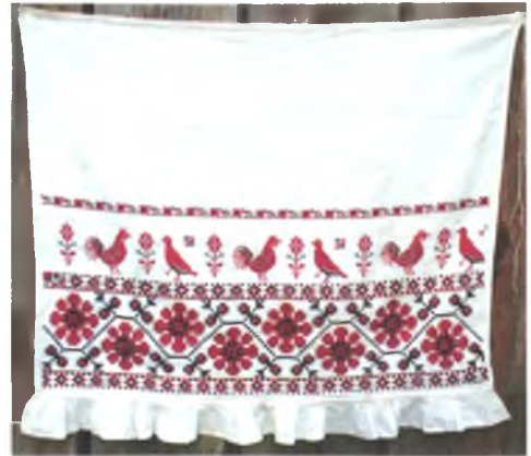
Мал. 1061. Фаргух. Пачатак XX ст. Паркаль, вышыўка крыжыкам (в. Рычоў, Жыткавіцкі раён). Тураўскі краязнаўчы музей, кп 1679 пр 213

блівала жанчын тым, што давала магчымасць сэканоміць на нітках, каб было чым вышываць для сябе: “После вайны аткрылі вышывальны цэх у Карме. Рубашкі нашывалі, бо рубашкі гэтыя паркалёвыя, тоненькія. Тожа ж у камінку нашывалі. Бярэш рубашку эту за заблаццю, што, ага, круцялёк за тры нітачкі, каб жа болей далі сарочак бярэш. Каб далі штук пяць-шэсць нашываць гэтых і ніткі, каб ужо асталося хоць нітак ужо. Забалаць эта называецца, тады ўжо нашываем сабе. Аканомілі. Яны загадваюць там па тры ніткі нашываць на рубашку, а мы ўжо дзелаем тады па дзве, тады ўжо нітачка асталеца. А тады ўжо разгледзілі, што неправильна дзелаюць. Штрафавалі, тады ўжо плату меншую давалі за рубашкі, і тады ўжо прыказ — не даваць гэтым, што ніткі... Ну, стараліся, каб ня ўціснуць іх крэпка, еслі ўціснеш — больш відна, а еслі ўжо слабей пускаеш, тады яно ўжо заглажаецца, эта ўжо белае. ...І мы ўсе бралі эту забалаць, і не дай бог, як красіво было!” (Хрысціна Бурдоленка, 1930 г.н., в. Акцяброва, Кармянскі раён. Зап. 2003 г.).