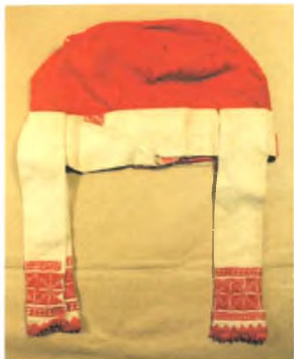
Мал. 1039. Галаўны ўбор (чапец і намітка). XIX ст. Лён, шарсыяная тканіна, вышыўка лікавай гладзю і крыжыкам (Гомельскі павет Магілёўскай губерні). Музей антрапалогіі і этнаграфіі (Кунсткамера) імя Пятра Вялікага Інстытута антрапалогіі і этнаграфіі РАН, № 415 – 14 а, в

У XIX – пачатку XX ст. характэрныя лакальныя асаблівасці вышыўкі лікавай двухбаковай гладзю існавалі на тэрыторыі сучасных Добрушкага і Гомельскага раёнаў і суседніх раёнаў Чарнігаўскай і Сумскай абласцей Украіны. Вышыўка мае адметны арнамент у выглядзе ромбаў, кружкоў, якія выконваліся чырвонымі, чырвонымі і блакітнымі або толькі белымі ніткамі. Вышыўцы двухбаковай лікавай гладзю ўласцівы рэльефнасць і шчыльнасць. Яна спалучалася з элементамі, вышытымі ў тэхніцы “ропіс” і крыжыкам. Лікавая двухбаковая гладзь ужывалася для аздаблення жаночых сарочак і галаўных павязак–“апаясак”. Узоры такіх вышываных вырабаў прадстаўлены ў беларускіх зборах Музея антрапалогіі і этнаграфіі (Кунсткамера) (мал. 1039) і Расійскім этнаграфічным музеі ў Санкт-Пецярбургу 1 . Галаўныя павязкі–“апаяскі” насілі дзяўчаты–нявесты. Маладыя жанчыны першага года замужжа павязвалі “апаяскі” на чапец так, каб канцы спускаліся на спіне або па баках. Двухбаковай гладзю “былым па белама” вышывалі жаночыя сарочкі ў Добрушскім і Веткаўскім раёнах (мал. 1040, 1041).