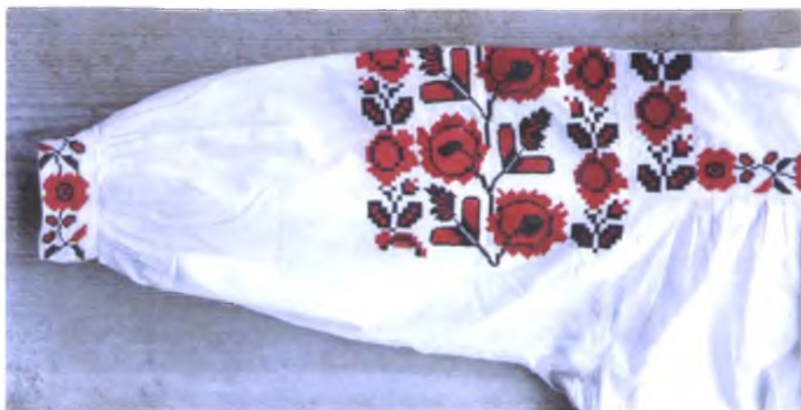
Мал. 1063. Сарочка на гестцы. 1940-я гг. Паркаль, бавоўна, вышыўка крыжыкам (в. Данілевічы, Лельчыцкі раён)

ровых нітак мулінэ кітайскай і айчыннай вытворчасці. Асабліва захапляліся вышыўкай карцінак жанчыны ў вёсках Лельчыцкага і Жыткавіцкага раёнаў. І сёння ў вясковых дамах можна ўбачыць такія вышыўкі на разнастайныя сюжэты: прыгажуні, пары закаханых, пастаральныя сцэнкі і інш. Найбольш таленавітыя жанчыны самі складалі кампазіцыі вышывак і выкарыстоўвалі для гэтага розныя крыніцы.