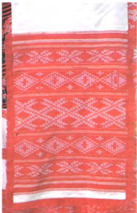
Мал. 956. Ручнік. 1950-я гг. Лён, ба- воўна, пераборнае ткацтва (в. Не- глюбка, Веткаўскі раён)