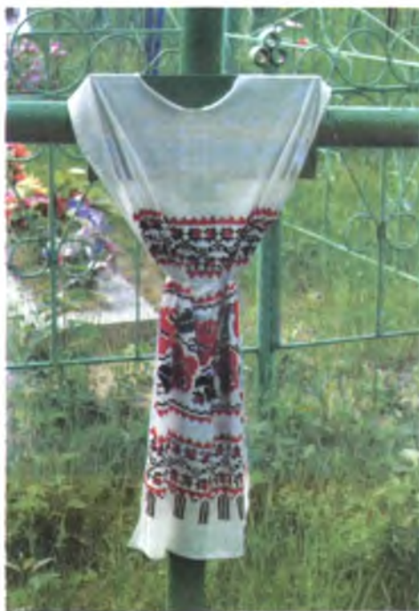
Мал. 1017. Надмагільны крыж з вышываным ручніком на Радаўніцу (в. Здудзічы, Светлагорскі раён). 2010 г.

У в. Слабада Лельчыцкага раёна прынята было пры пахаванні засцілаць века дамавіны настольнікам. Гэты звычай тлумачаць наступным чынам: “Штоб свой стол быў. Ужэ ўстае. То это відом, ліцом устае, а на ногі