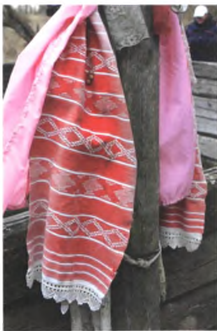
Мал. 1075. Ручнікі на аброчным крыжы каля святой крыніцы ў в. Будзішча Чачэрскага раёна. 2010 г.