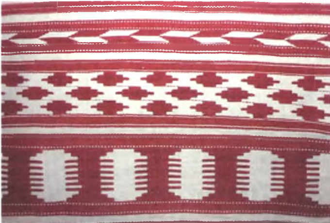
Мал. 944. Ручнік. Канец XIX ст. Лён, бавоўна, закладное і шасцінітовае ткацтва (в. Рыскаў, Рагачоўскі раён). ДГКУ “Гомельскі палацава-паркавы ансамбль”, кп 15545/1

Больш шырока, чым у іншых рэгіёнах Беларусі, на Гомельшчыне ўжывалася закладное ткацтва, якое дазваляе атрымліваць аднолькавы арнамент на абодвух баках тканіны. У Жыткавіцкім раёне ўзорамі закладнога ткацтва аздаблялі сярпанкі, якія да пачатку ХХ ст. з’яўляліся часткай мясцовага галаўнога ўбору, а таксама прыполы жаночых сарочак. У Чачэрскім раёне закладное ткацтва ўжывалі для ткання фартухоў, настольнікаў, ручнікоў (мал. 943). У Рагачоўскім і суседніх раёнах былі распаўсюджаны ручнікі закладнога ткацтва з характэрнымі ўзбуджэнымі арнаментальнымі матывамі (мал. 944). На поўдні Гомельскай вобласці ў сумежным з Ук-