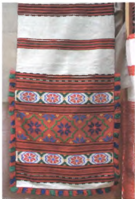
Мал. 992. Ручнік. Фрагмент. 1970-я гг. Бавоўна, пераборнае ткацтва (в. Неглюбка, Веткаўскі раён)