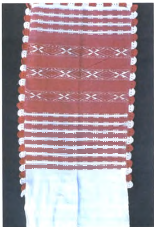
Мал. 989. Ручнік. Пачатак XX ст. Лён, бавоўна, пераборнае ткацтва (в. Палессе, Чачэрскі раён)

Чырвоныя манументальныя доўгія ручнікі бранага ткацтва паходзяць з паўднёвай часткі Чачэрскага раёна і вядомы ў літаратуры пад назвай “чачэрскія”. Мясцовая назва ручнікоў – “красныя ручнікі”. Адпаведна тэхніцы выканання спосабам бранага ткацтва іх называлі “закладанымі”. Цэнтрамі вырабу ручнікоў гэтага лакальнага варыянта да 1920-х гг. былі вёскі Бабічы, Покаць, Нісімкавічы, Валосавічы. Арэал іх распаўсюджання ахоплівае суседні Кармянскі раён і паўночную частку Веткаўскага раёна.