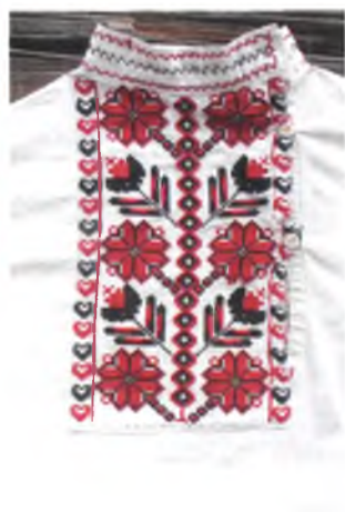
Мал. 1059. Манішка мужчынскай сарочкі. 1940-я гг. Паркаль, вышыўка крыжыкам (в. Мілевічы, Жыткавіцкі раён)

ненне вышытых крыжыкам бардзюраў характэрна для сарочак Добрушкага і Калінкавіцкага раёнаў (мал. 1056, 1057). Выразную мастацкую з’яву ўяўляе арнаментальны дэкор сарочак калінкавіцкага строю. Узоры крыжыкам на рукавах захавалі папярэдняю традыцыю зубчатага завяршэння бардзюраў у ніжняй частцы рукава. Сеткавым характарам вырашэння кампазіцыі вышыўкі і выявамі рэзтак адметныя сарочкі чачэрскага строю.