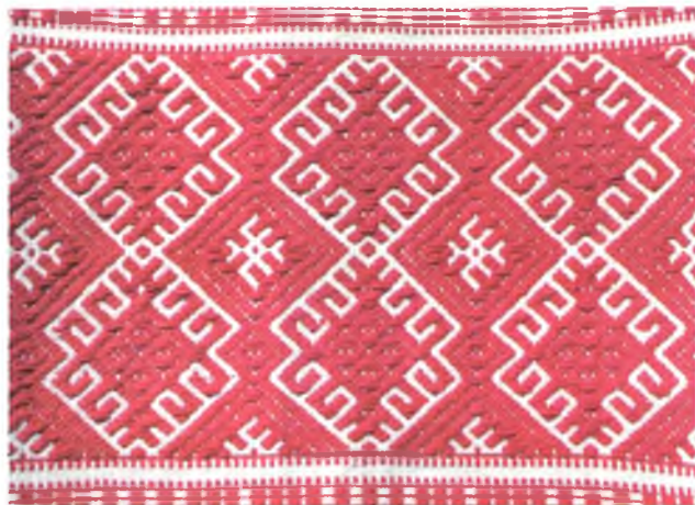
Мал. 939. Ручнік. Фрагмент. 1920-я гг. Лён, бавоўна, бранае ткацтва (в. Амяльное, Веткаўскі раён). Веткаўскі музей стараабрадніцтва і беларускіх традыцый імя Ф.Р. Шклярава, кп 760/2