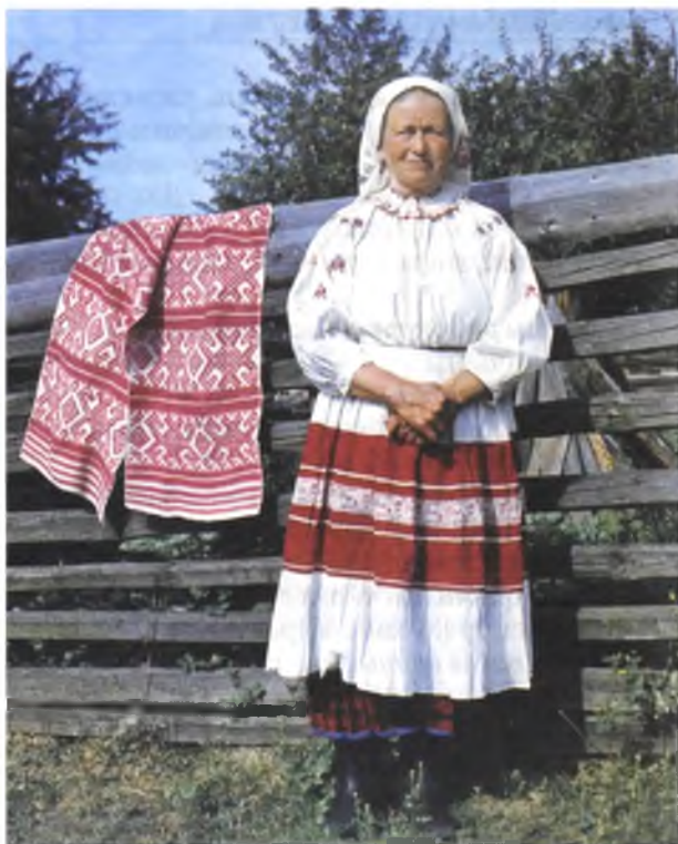
Ручнікі. Пачатак XX ст. Лён, бавоўна, бранае ткацтва (в. Палессе, Чачэрскі раён)