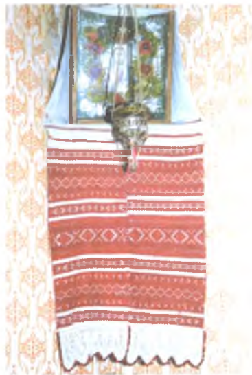
Мал. 997. Кут з набожнікам (в. Чыркавічы, Светлагорскі раён). 2005 г.