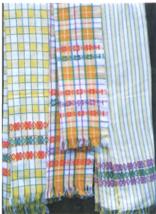
Мал. 1012. Ручнікі на падарункі. 1970-я гг. Бавоўна, ткацтва ў чатыры ніты. 165 × 35 см. Ташыяна Радзько, 1931 г.н. (в. Малыя Аўцюкі, Калінкавіцкі раён). 2005 г.

Семантыку шляху і медыятара паміж “гэтым” і “тым” светам захоўваў ручнік у пахавальна-памінальнай абраднасці. Трывала існавала ўяўленне пра тое, што і на “тым” свеце ручнік будзе патрэбны чалавеку. Невазікі вузькі “рушнічок” (маглі вышыць, раней былі тканыя) затыкалі за пояс нябожчыку, як мужчынам, так і жанчынам, “штобы на тым свеце ўціраўся” (в. Сінічына, Буда-Кашалёўскі раён). Ручнік клалі ў труну: “Кажуць, будзе ўцірацца