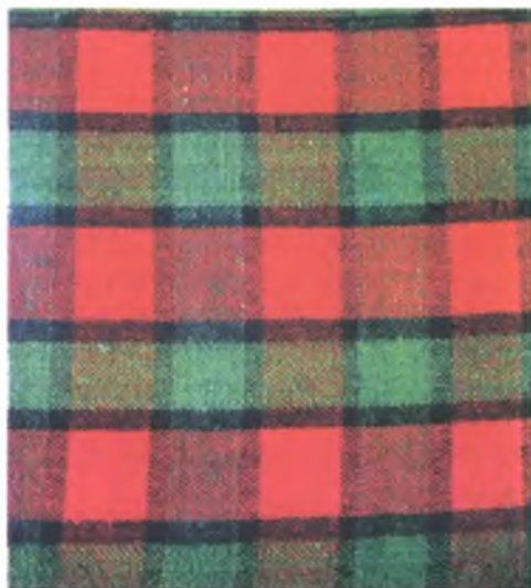
Мал. 1022. Посцілка. Фрагмент. 1940-я гг. Воўна, чатырохнітовае ткацтва “ёлачка” (в. Цешкаў, Нараўлянскі раён)

Вытанчаным спалучэннем блакітнага, светла-зялёнага з цёмна-карычневым, сінім, чырвоным, аранжавым колерам вылучаюцца посцілкі Петрыкаўскага раёна. Больш яркая колеравая гама характэрна для посцілак Жыткавіцкага, Лельчыцкага раёнаў. У Калінкавіцкім раёне чатырохнітовыя посцілкі з рознакаляровымі палосамі атрымалі назву “перасяканкі”. Рады ўзорных элементаў ткалі ў тры-чатыры колеры, што стварае ўражанне паліхромнасці (мал. 1023, 1024).