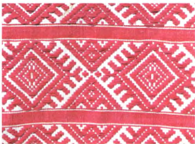
Мал. 940. Ручнік. Фрагмент. 1910-я гг. Лён, бавоўна, бранае ткацтва (в. Бабічы, Чачэрскі раён). Веткаўскі музей стараабрадніцтва і беларускіх традыцый імя Ф.Р. Шклярава, кп 591/1

ў бардзюрах па ўсёй шырыні тканіны, адлюстраваны ў наступных словах ткачыхі: “Працягваю забалаццю ад берага да берага” (в. Акцяброва, Кармянскі раён).