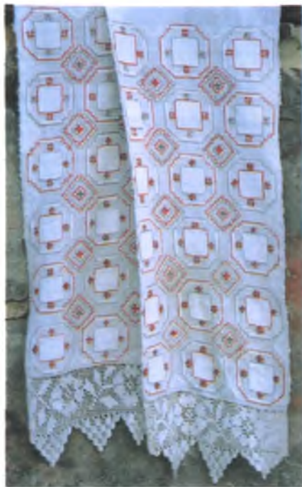
Мал. 950. Набожнік. Пачатак XX ст. Лён, бавоўна, аднабаковы перабор, вышыўка. 300 × 30 см. Школьны музей в. Валосавічы Аццябрскага раёна