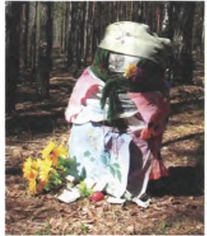
Мал. 1082. Аброчны крыж “камень-дзевачка” ў лесе каля в. Баравая Лельчыцкага раёна. 2009 г.