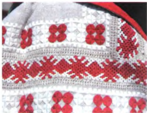
Мал. 1053. Сарочка жаночая. Фрагмент рукава. Пачатак XX ст. Лён, бавоўна, лікавая гладзь, злучальнае шво (в. Неглюбка, Веткаўскі раён)