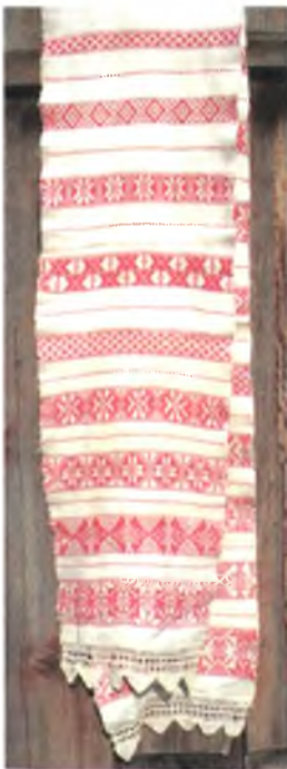
Мал. 969. Ручнік. Пачатак XX ст. Лён, баваўна, бранае ткацтва (в. Тонеж, Лельчыцкі раён). Тураўскі краязнаўчы музей, кп 1339 пр 80

Даўнія браныя ручнікі Брагінскага, Хойніцкага, Нараўлянскага раёнаў адметныя сваімі кампазіцыямі і разнастайнасцю геаметрычных арнаментаў. Сустрэкаюцца ручнікі, на якіх налічваецца да 20 бардзюраў з рознымі геаметрычнымі элементамі. Шырыня арнаментаваных бардзюраў паступова зужаецца ад нізу ручніка да яго сярэдзіны. Палосы часцяком размешчаны па ўсім полі ручніка з досыць шырокімі прабеламі фону паміж імі (мал. 969, 970).