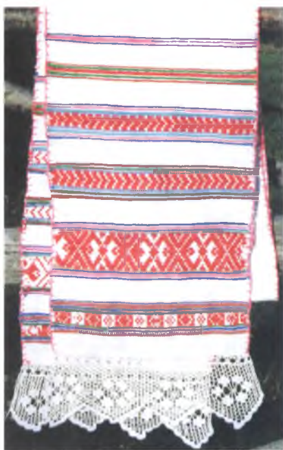
Мал. 958. Ручнік. 1960–1970-я гг. Бавоўна, лен, бранае і чатырохнітовае ткацтва “ў касіцы” (в. Данілевічы, Лельчыцкі раён)