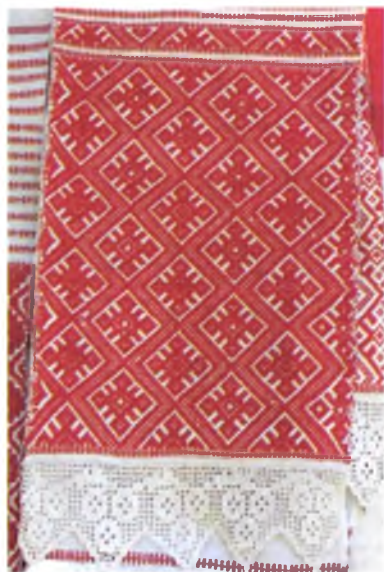
Мал. 977. Ручнік. Пачатак XIX ст. Лён, бавоўна, бранае ткацтва (в. Прысно, Веткаўскі раён). Веткаўскі музей стараабрадніцтва і беларускіх традыцый імя Ф.Р. Шклярава, кп 422/1