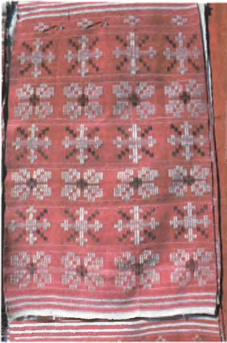
Мал. 953. Ручнік. 1910-я гг. Лён, бавоўна, пераборнае ткацтва (в. Стаўбун, Веткаўскі раён). Веткаўскі музей стараабрадніцтва і беларускіх традыцый імя Ф.Р. Шклярава, кп 762 /1