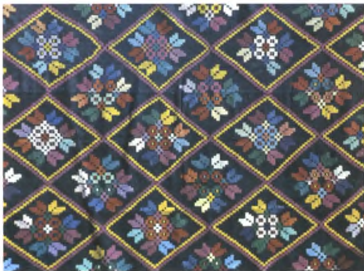
Мал. 960. Посцілка. 1960-я гг. Лён, бавоўна, воўна, аднабаковы перабор (в. Данілевічы, Лельчыцкі раён)