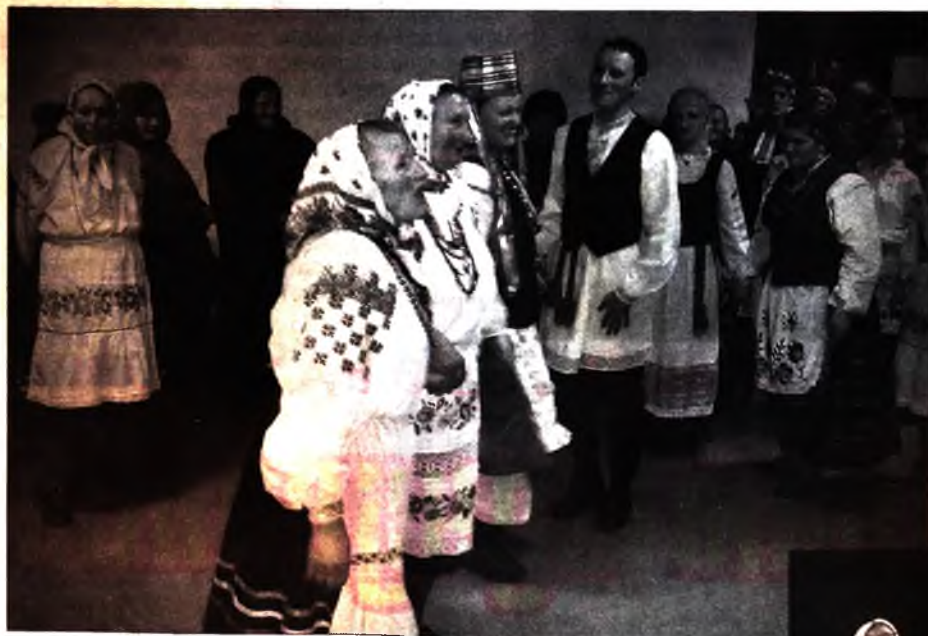
У час бенефісу "Стаўбунскіх вячорак", 2013 год.

Гэтыя спявачкі рэпрэзентуюць культуру тысячадворнай вёскі... Яны жасноўныя завадатары і арганізатары мясцовых каляндарных абрадаў. Майстэрскае валоданне традыцыйным рэпертуарам