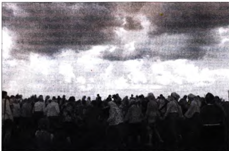
Карагод у жыце на абрадзе "Ваджэнне і пахаванне Стралы" ў Стаўбуне, 2010 год.

стаўбунскія спявачкі, — сапраўдны помнік тысячагадовай культуры нашай зямлі. Як толькі людзі на ёй пачалі жыць аседла, апрацоўваючы глебу, пачалі фарміравацца каляндарныя святы. Імі першыя земляробы ўпісвалі сваю супольнасць у матчын ландшафт, магічна ўпарад-