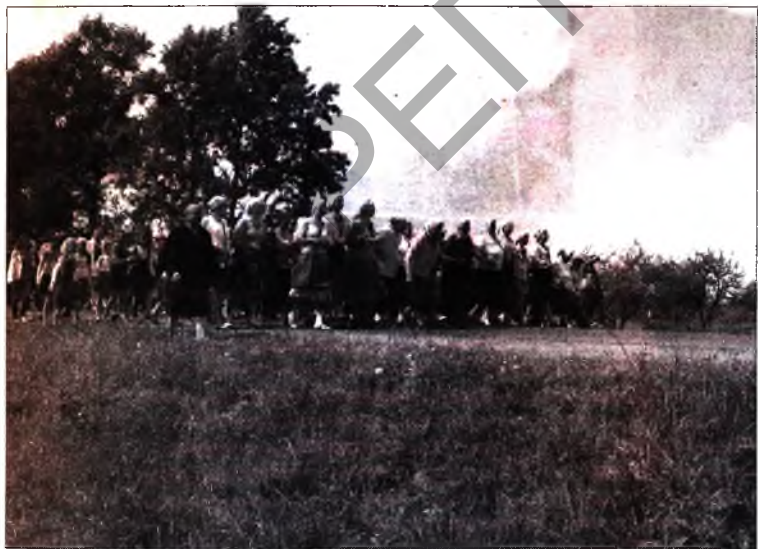
Шэсце да жыта на абрадзе "Ваджэнне і пахаванне Стралы" ў Стаўбуне, 2010 год.

абраду "Страла" статус нематэрыяльнай культурнай спадчыны Беларусі, і мясцовы аддзел культуры на чале з Аляксандрам Бандарэнкам, які наладзіў нядаўняе ганараванне гурта-юбіляра, і сталічны ўніверсітэт культуры, рэктар якога — Юрый Бондар — даслаў свае віншаванні, і студэнцкі фальклорны ансамбль, і этнографы Беларусі, Расіі, Украіны і Літвы, якія штогод наведваюць веснавыя абрады Стаўбуна. Сутнасць гэтых агульных намаганняў — клопат пра каранёвую культуру Беларусі, без спадчыны якой шлях народа ў будучыню будзе няўстойлівы і няўпэўнены. Але, пакуль над Пасожжам гучыць жывы гук стаўбунскіх песень, арыенціры для самасвядомасці і самапавагі ў беларусаў маюцца і захоўваюцца. Таму доўгіх гадоў жыцця, творчага плёну і зацікаўленых вучняў вам, "Стаўбунскія вячоркі", носьбіты лініі жыцця архаічных песень Беларусі!