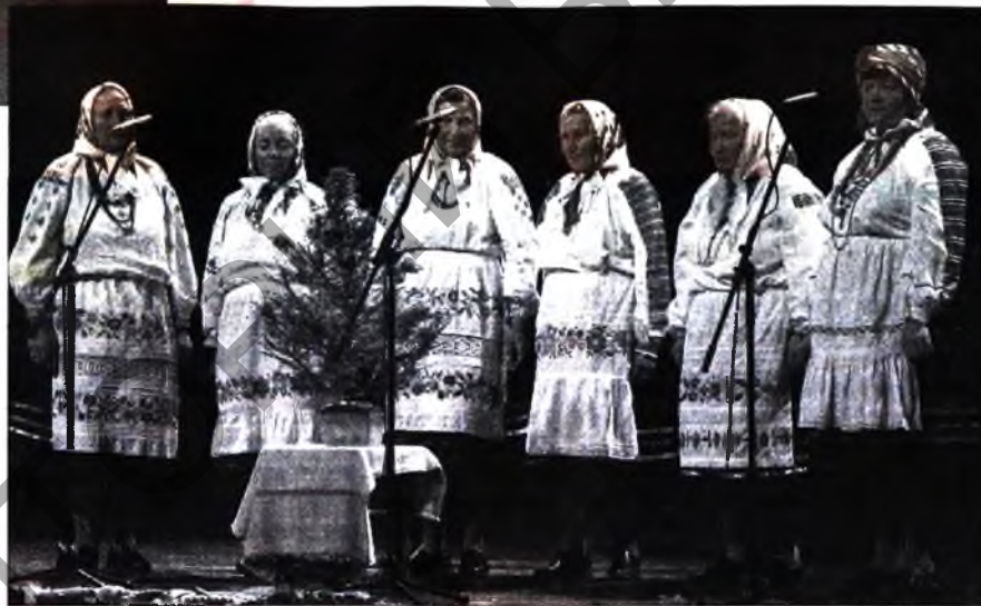
"Стаўбунскія вячоркі" на фестывалі ў Літоўскай Рэспубліцы, 2011 год.

Як бачым, у намаганнях па ахове традыцыйнай спадчыны Веткаўшчыны сёння ўдзельнічаюць прадстаўнікі розных рэгіёнаў краіны і розных частак сацыяльна-культурнай сферы Беларусі і замежжа. Гэта і