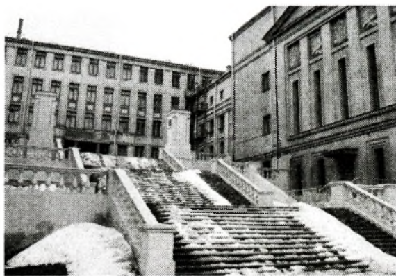
Рис. 8. Лестница Дома офицеров