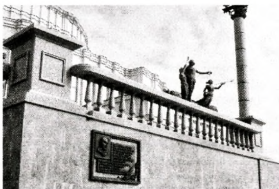
Рис. 10. Большой театр оперы и балета Республики Беларусь