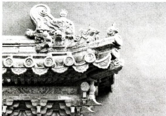
Рис. 7. «Запретный город». Пекин

...Дворцово-парковый ансамбль Петергофа (Петродворец) исходно имеет выразительную тему и знаменательный мотив – утверждение имперского духа и провозглашение победоносного выхода на Балтику, во всю Европу. Отсюда