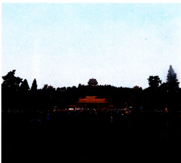
Рис. 3–6. «Запретный город». Пекин