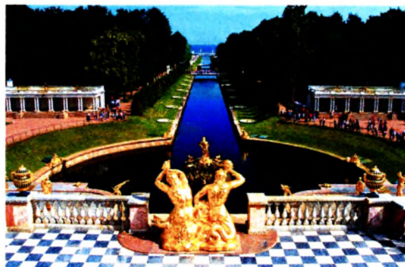
Рис. 1–2. Ансамбль Петергофа