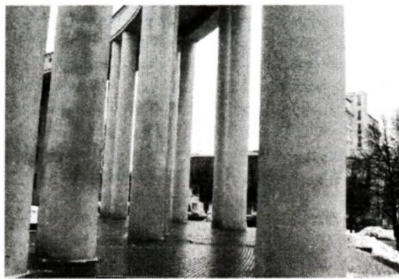
Рис. 9. Колоннада Академии наук