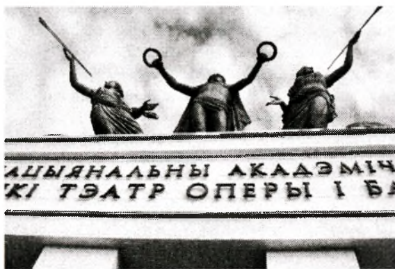
Рис. 11. Большой театр оперы и балета Республики Беларусь