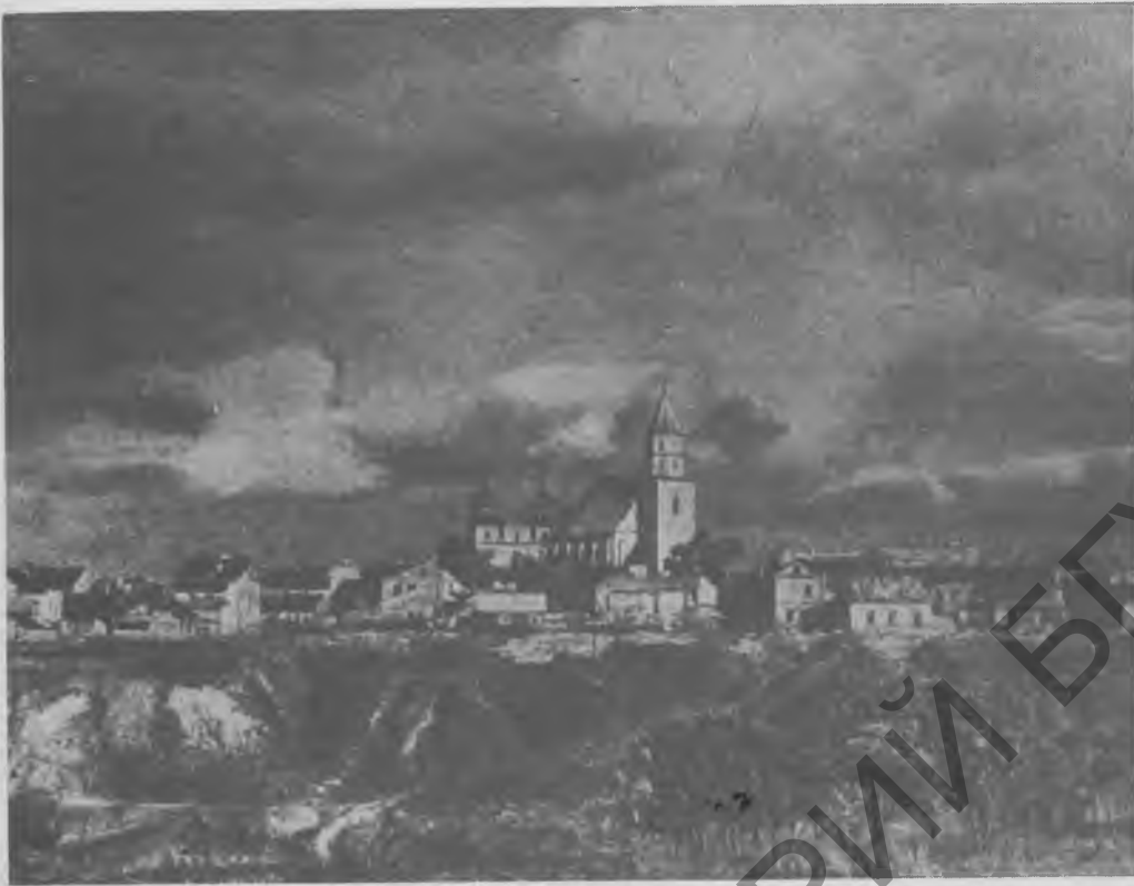
Выгляд Гродна 1939 г.

Матэрыялы археалагічных раскопак (пачатак 1990-ых гг.).