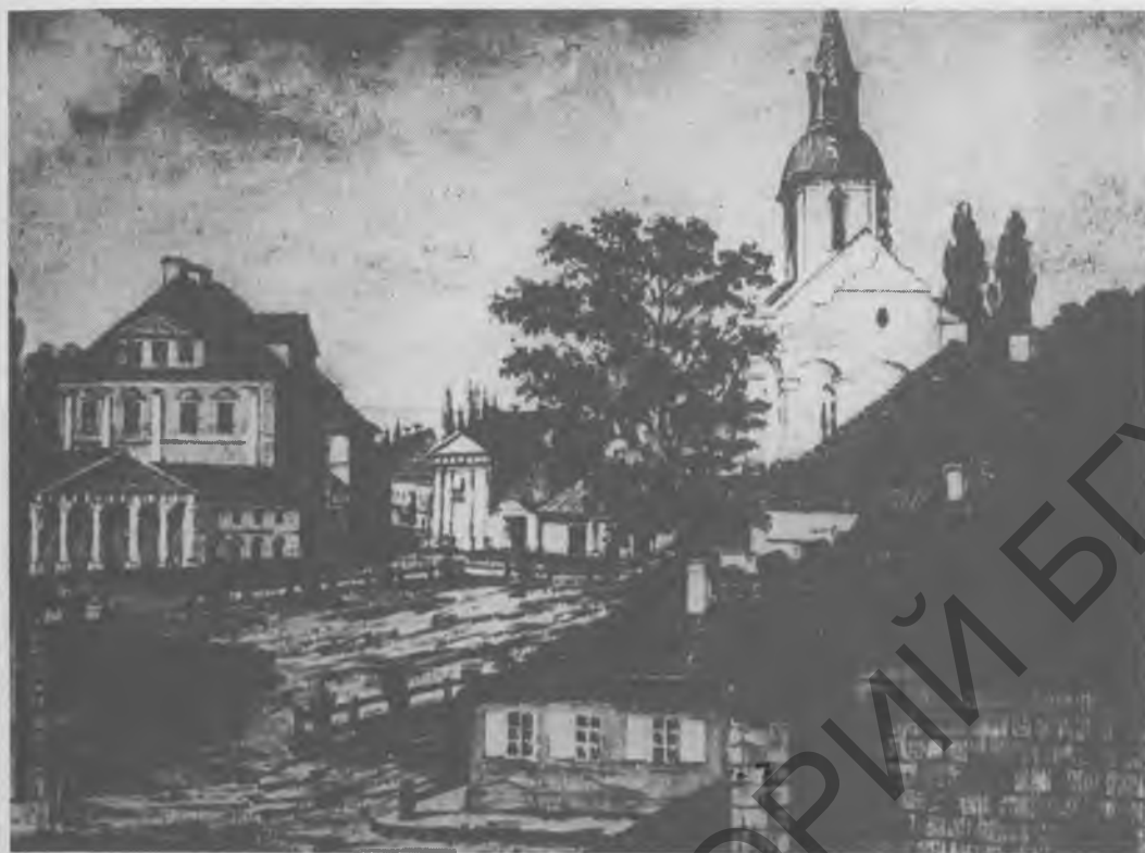
Малонак Напалеона Орды.

Матэрыялы археалагічных раскопак (пачатак 1990-ых гг.).