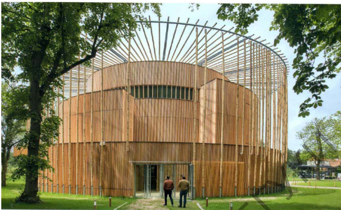
Рис. 1. Театр в г. Булонь-сюр-Мер, Франция, 2016 г. Арх. Андрей Тодд