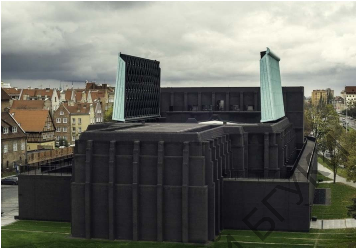
Рис. 3. Театр в г. Гданьске, Польша, 2008 г. Арх. Ринато Рицци