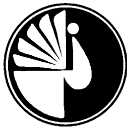
Малюнак 2 – Першы лагатып БУК, 1992