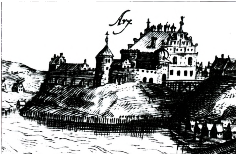
Стары замак у Гродне на гравюры Т.Макоўскага. Пачатак XVII ст.

У гэты час майстры, якія выраблялі цэглу і дахоўку, а потым і пліткі для падлогі, выйшлі са складу будаўнічых арцеляў, працавалі самастойна і прадавалі сваю прадукцыю непасрэдна замоўцу. Яны аб'ядноўваліся ў асобныя цэхі, сярод якіх былі мулярскі і цясларскі.