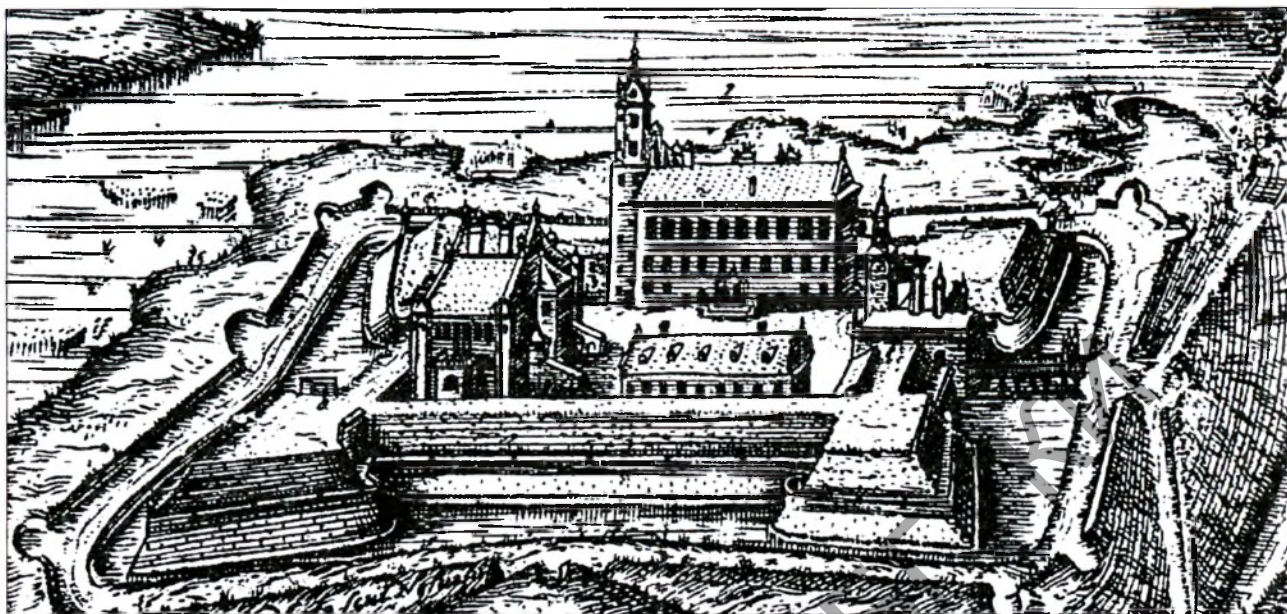
Нявіжскі замак на гравюры Т. Макоўскага. Пачатак XVII ст.

ганцавая), глухая жоўтая (зафарбаваная вокіслам сурмы), светла-зялёная (сумесь жоўтай і сіняй). Выразнасць малюнка падкрэсліваў рэльеф кафлі.