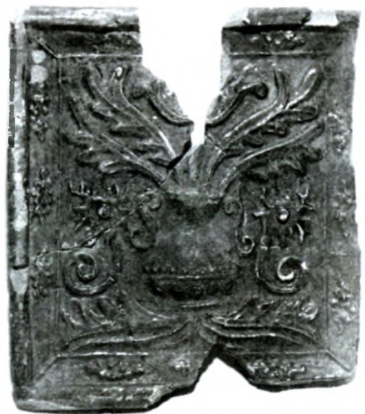
Рэнесансавая кафля з выявай кветкі ў вазоне. Крэўскі замак. Раскопкі аўтара.

Падчас раскопак аднаго з замкавых карпусоў намі быў знойдзены нескрануты фрагмент падлогі канца XVI ст., зробленай з керамічных плітак, пакрытых карычневай ці жоўтай палівай. Пліткі былі пакладзеныя на слой вапнавай рошчыны таўшчынёй ад 2 да 5 см.