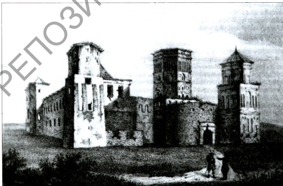
Канут Русецкі. Мірскі замак. 1853 г.

Тэхналогію вырабу аднатоннай паліванай кафлі і складаную тэхналогію вырабу паліхромнай (шматколернай) кафлі прынеслі ў ВКЛ італьянскія майстры. Пад уплывам Рэнэсансу на беларускіх кафляных пачынаюць з'яўляцца антрапаморфныя выявы, якія часам складаюць цэлыя кампазіцыі. Першая, най-