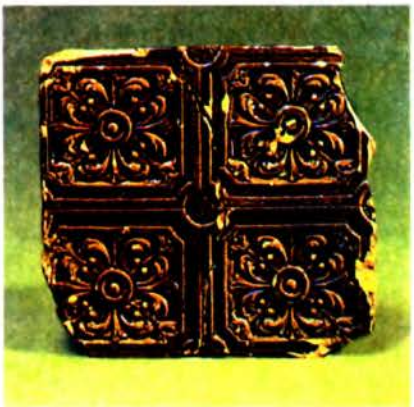
Да арт. Навагрудская кафля . Паліваная кафля з малюнкам дывановага тыпу. 17 ст.

НАВАГРУДСКАЯ РАТУША . Існавала ў 17—19 ст. у г. Навагрудак Гродзенскай