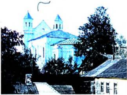
Навагрудская Барысаглебская царква. Выгляд з боку апсіды.

Літ. : Трусов О.А. Борисоглебская церковь XII в. из Новогрудка // Памятники старины. Концепции. Открытия. Версии. СПб., Псков, 1997. Т. 2. А.А.Трусов.