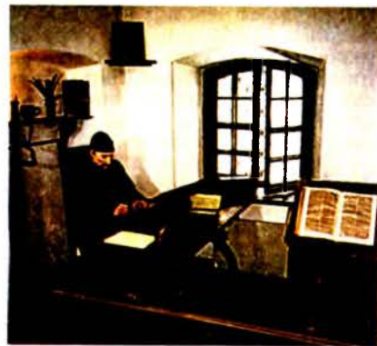
У адной з залаў Полацкага музея беларускага кнігадрукавання.

Адкрыты 7.9.1990 у г. Полацк Віцебскай вобл.; філіял Нац. Полацкага гісторыка-культурнага музея-запаведніка . Размешчаны ў будынку б. жылога корпуса Богаюўлеўскага манастыра. Пл. экспазіцыі 670 м 2 , больш за 1,2 тыс. экспанатаў асн. фонду (2000). Тэматычныя раздзелы: развіццё пісьменства, форм і матэрыялаў кнігі; рукапісная кніга на Беларусі; жыццё і дзейнасць Ф.Скарыны; Скарыніна; кнігадрукаванне 2-й пал. 16—18 ст. і 19—пач. 20 ст.; гісторыя кніжнай ілюстрацыі; развіццё паліграфіі. Сярод экспанатаў помнікі слав. пісьменнасці 11—13 ст., у т.л. прасліцы, фрагменты керамікі, плінфы, тынкоўкі з надпісамі, кірылічныя і лац.-польск. выданні 16—пач. 20 ст. («Евангелле вучыцельнае», 1595; «Катэхізіс» Л.Зізанія, 1788; «Кніга аб веры», 1785 і інш.); выданні зах.-еўрап. друкарняў 16—19 ст. («12 прамоў» І.Фалецкага, 1558; «Фландрыя ў ілюстрацыях» А.Сандэра, 1644 і інш.); фрагмент Торы (канец 18 ст.), маст. творы, навук. працы, падручнікі, слоўнікі, часопісы, газеты, календары, альбомы, буклеты, паштоўкі і інш. выданні 2-й пал. 19—1-й пал. 20 ст.; выданні прыватных Кухты М. друкарні , Знамя роўскага У. выдавецтва , Клецікіна Б.А. выдавецтва , друкарня І.Мятлы і І.Дварчаніна, выдавецтва В.Ластоўскага, суполкі «Загляне сонца і ў наша аконца», т-ва «Адраджэнне» і інш.; працы і даследаванні пра жыццё і творчы спадчыну Скарыны, матэрыялы Скарынаўскіх чытанняў і міжнар. канферэнцый;