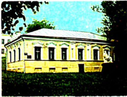
Полацкі жылы дом.

ПОЛАЦКІ ЖЫЛЫ ДОМ , дом Пятра I, помнік архітэктуры з элементамі стылю барока ў г. Полацк Віцебскай вобл. Пабудаваны ў 1692 у цэнтры горада як жылы (на мяжы 18—19 ст. перабудаваны). Мураваны I-павярховы (з паўпавальным павярхам) будынак мае ў плане форму няправільнага прамавугольніка. Плоскасці сцен прарэзаны высокімі прамавугольнымі аконнымі праёмамі з ліштвамі і фігурнымі сандрыкамі, цэнтр. ч. гал. фасада — 2 прафіляванымі філенгамі. Тарцовы фасад завершаны фігурным атыкам з ляпнымі разеткамі (перароблены ў 19 ст.). Парадныя ўваходныя дзверы дэкарыраваны расл. арнаментам і маскаронамі