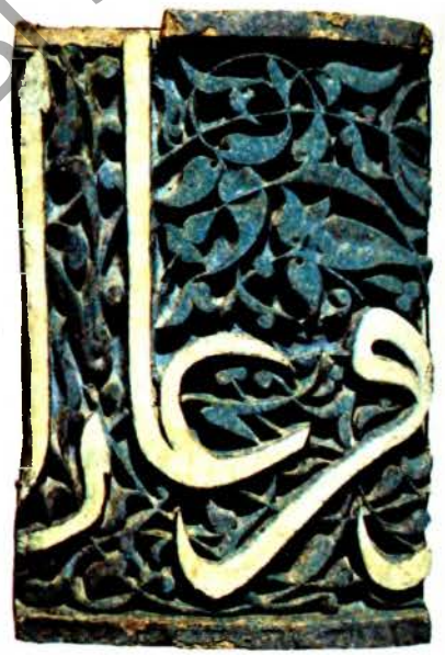
Кафля. Самарканд. 1340-я г.