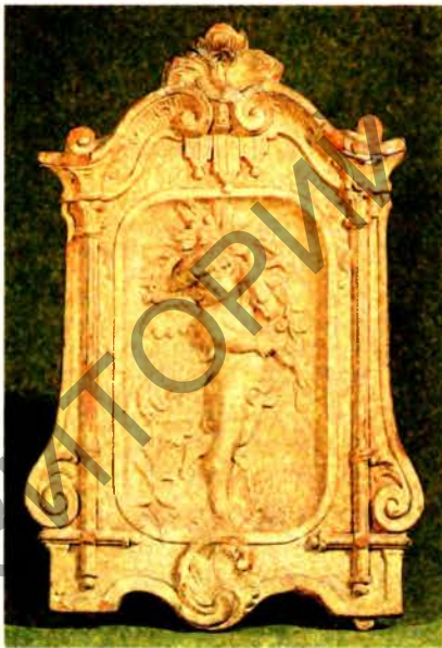
Мінская кафля (медальён). Пач. 20 ст.

звычайна аздаблялі геам. узорам, а таксама выявамі раслін, жывёл, сюжэтнымі кампазіцыямі на быт., гіст. і рэліг. тэмы. У канцы 16 — 1-й пал. 17 ст. бел. кафлярства дасягнула найб. росквіту. Маст. якасцямі вызначалася паліхромная К., пакрытая белай, жоўтай, светла- і цёмна-зялёнай, блакітнай, цёмна-сіняй, карычневай палівай. У яе аздабленні (асабліва ў 17 — пач. 18 ст.) пераважала расл. і геральдычная тэматыка, часам з надпісамі на лацінцы або кірыліцы, пазначэннем года вырабу. З 2-й пал. 17 ст. К. выраблялі ў т. зв. дыявановым стылі, дзе кожная асобная К. складала частку агульнага малюнка паверхні печы. Бел. кафлярства 17 ст. значна паўплывала на развіццё вытв-сці К. ў Рус. дзяржаве, дзе працавалі бел. майстры з Копысі, Месціслава, Дуброўны, Віцебска і інш. гарадоў, у т. л. Пётр Заборскі і Сцяпан Палубес (іх вырабамі аздаблены Церамны палац Крамля, Круціцкі царам, царква Георгія Неаке-