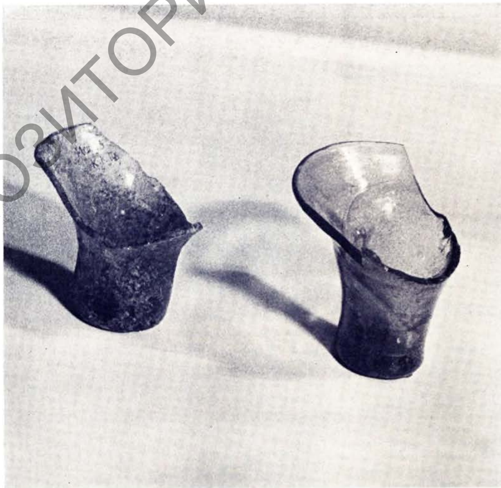
Звонападобныя кубкі. Першая палова XVII ст.