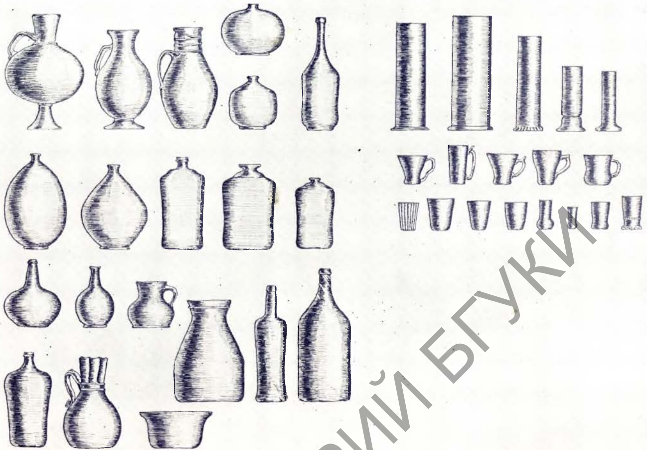
Мсціслаўскае шкло канца XVI—першай паловы XVIII стагоддзя. Рэканструкцыя.