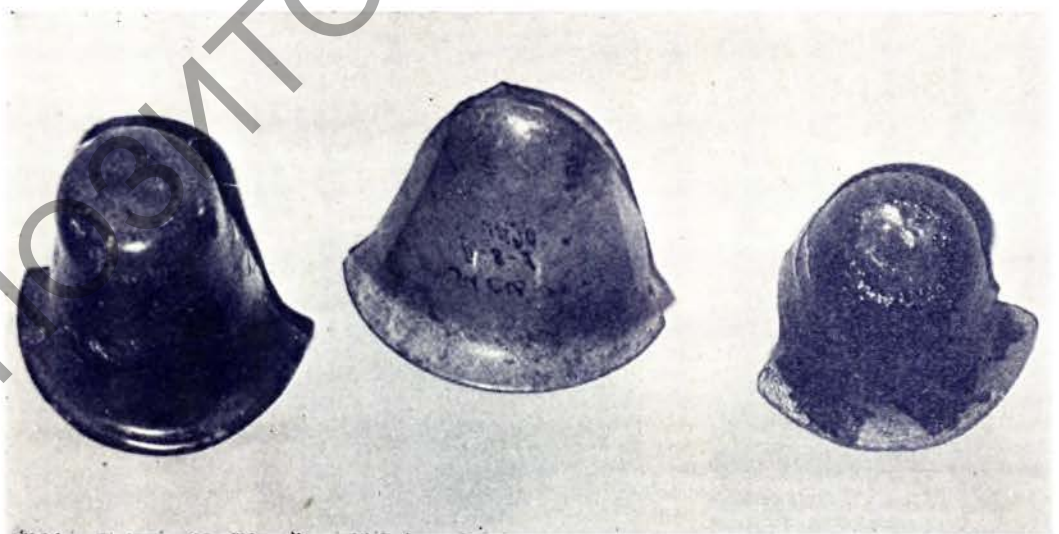
Звонападобныя кубкі. Першая палова XVII ст.

Мяркуецца таксама, што існавалі яшчэ дубальтовыя кубкі, для якіх першыя, між іншым, выступалі ў ролі паўфабрыкатаў. Падрабязна пра гэта гаворка ўжо вялася 6 . Дапоўнім толькі, што раскопкі 1984—1987 гадоў пацвярджаюць гіпотэзу. Менавіта, знойдзены асобныя канструкцыйныя элементы ад магчымых кубкаў: «яблыкі» адносна вялікіх памераў, дыскі,