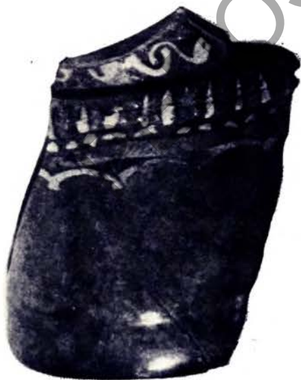
Шклянны збан. Першая палова XVII ст. Рэканструнцыя.