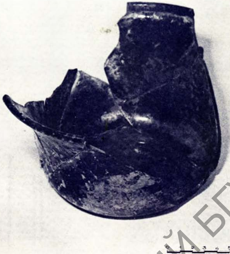
Шкляная міска. Першая палова XVII ст.

Кварты ў Мсціславе бытавалі розных канструкцый: высокія, квадратныя, плоскія, аднак у архітэктоніцы дамінавалі лініі вертыкалі. Адметнасць квартаў — пераважна прамыя плячкі і асобна ад тулава сфармаванае горла.