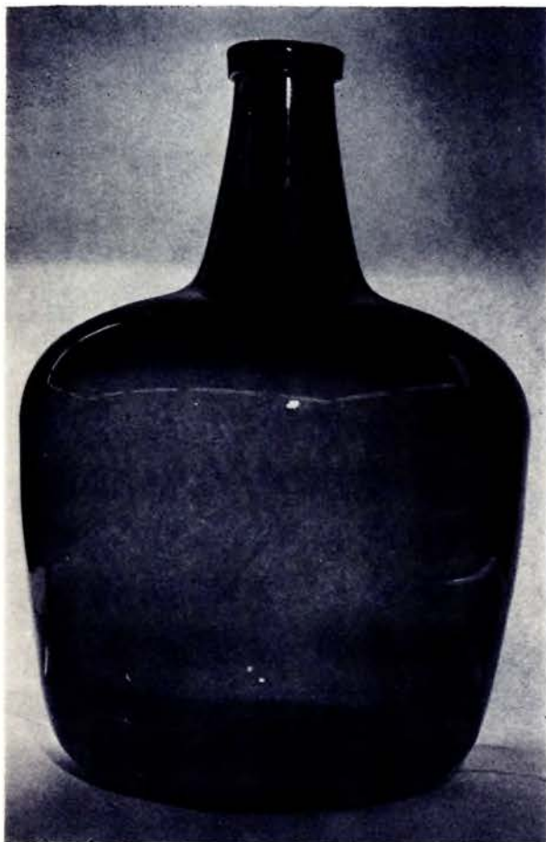
Бутля. XVII ст. Рэканструнцыя.