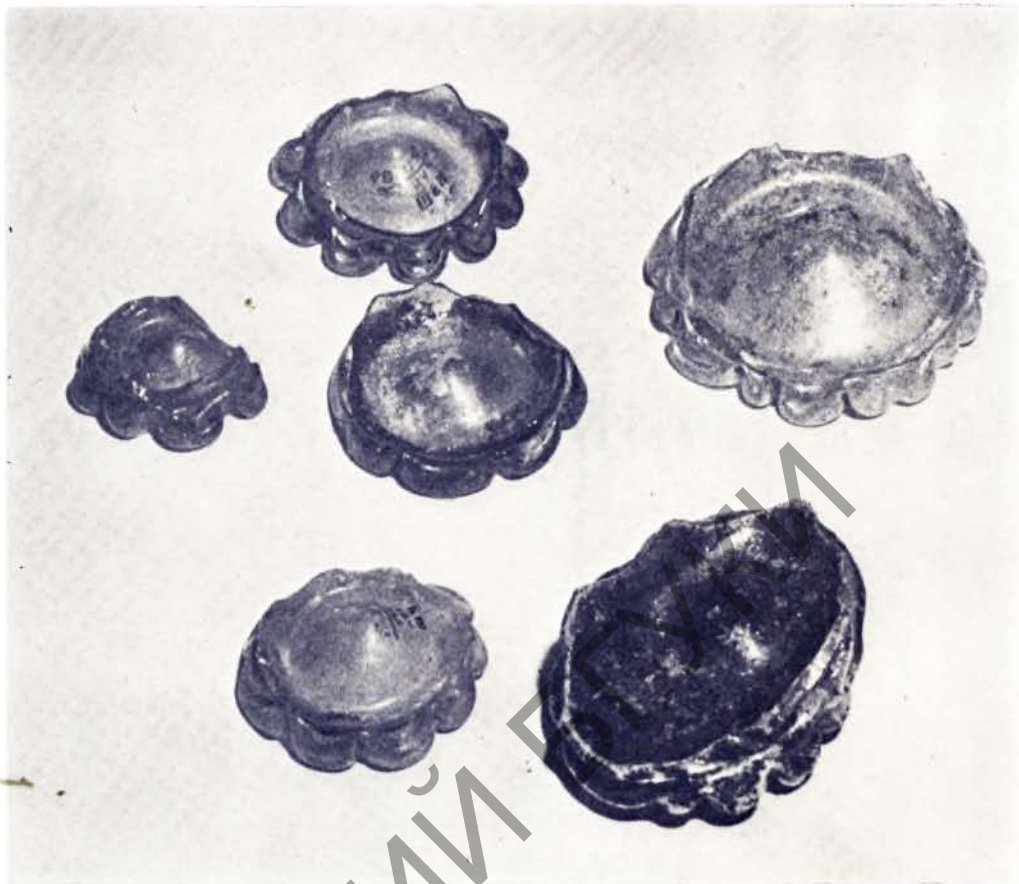
Фрагменты шклянці. Першая палова XVII ст.