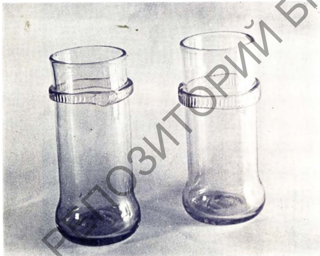
Шклянiцы. Першая палова XVII ст.

чыць куфляў і кубкаў, то тут зноў сустракаем з чыста мясцовым пераасэнсаваннем асвячонага традыцыяй вобраза.