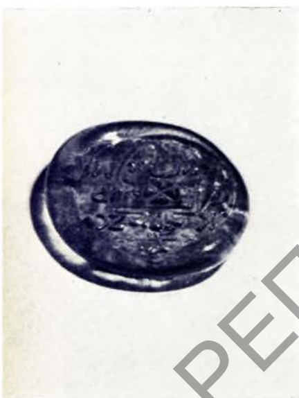
Шкляная пячатка з выявай герба К. Цаханавецкага. Першая палова XVII ст.