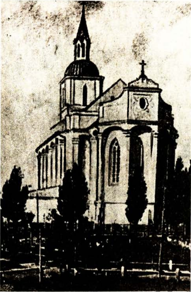
Гродзенскі фарны касцёл Прачыстай Боскай Маці (фара Вітайта). Упершыню згадваецца ў 1389 г. Узарваны ў 1961 г.

справаздачы гродзенскага губернатара за 1838 год ёсць звесткі аб скарге рымскіх манет, знойдзеных у Пружанскім уездзе і аб другім грашовым скарге з Наваградскага уезда.