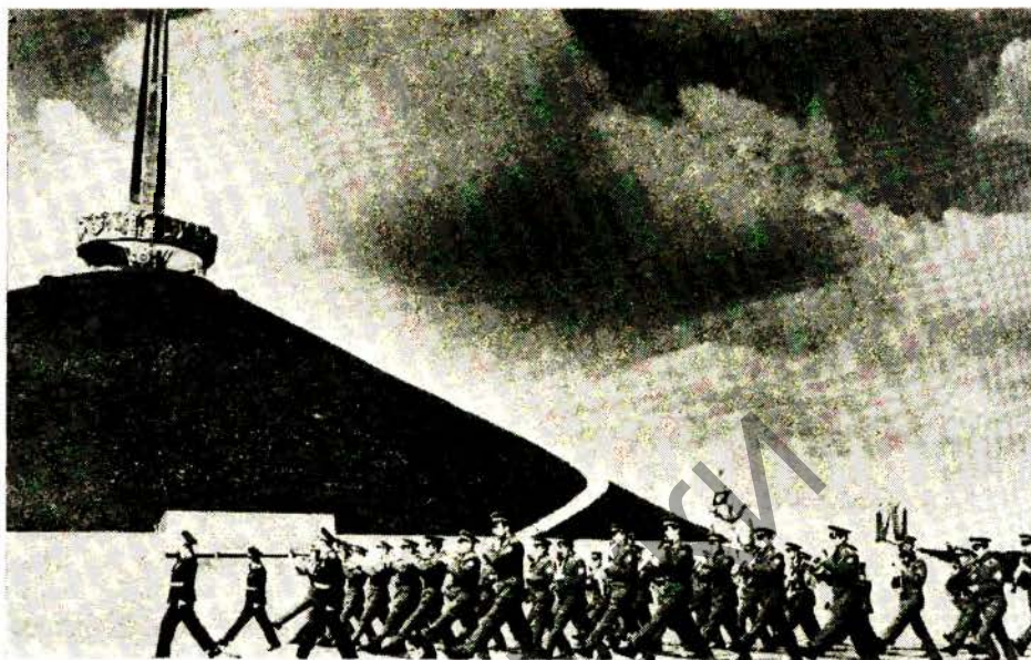
Калі Кургана Славы.

Важнае месца ў творчай дзейнасці аркестра надаецца не толькі рабоце па музычна-эстэтычнаму, але і ваенна-патрыятычнаму выхаванню воінаў акругі, працоўных Беларусі. Аркестр актыўна ўдзельнічаў у рабоце пленума Усеаюзнай камісіі ваенна-патрыя-