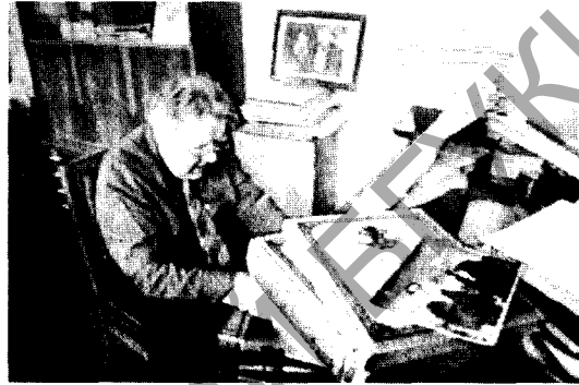
К ст. Музыкальный фильм. Кадр из видеофильма «Душа моя, Элизиум теней...». 1998.

чаева «Приключения в городе, которого нет» (1974, композитор С.Кортес), «Приключения Буратино» (1975), «Про Красную Шапочку. Продолжение старой сказки» (1977), «Сказка о Звёздном мальчике» (1983, композитор всех А.Рыбников), «Проданный смех» (1981, композитор М.Дунаевский), «Рыжий, честный, влюблённый» (1984), «Питер Пен» (1987, композитор обоих И.Ефремов). В конце 1970-х гг. появились первые муз. видеофильмы: видеомюзикл «Это долгое короткое время» (реж. В.Орлов, музыка Глебова, В.Раинчика), видеобалет «Три пальмы»