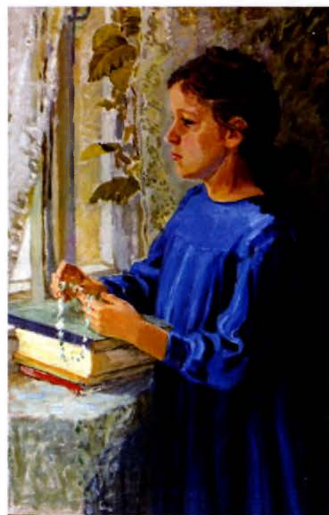
Партрэт дачкі. Палатно, алей. 1955.

Снежныя лавіны застылі ў руху каляровага ззяння. Бела-ружова-блакітныя снежныя мазкі