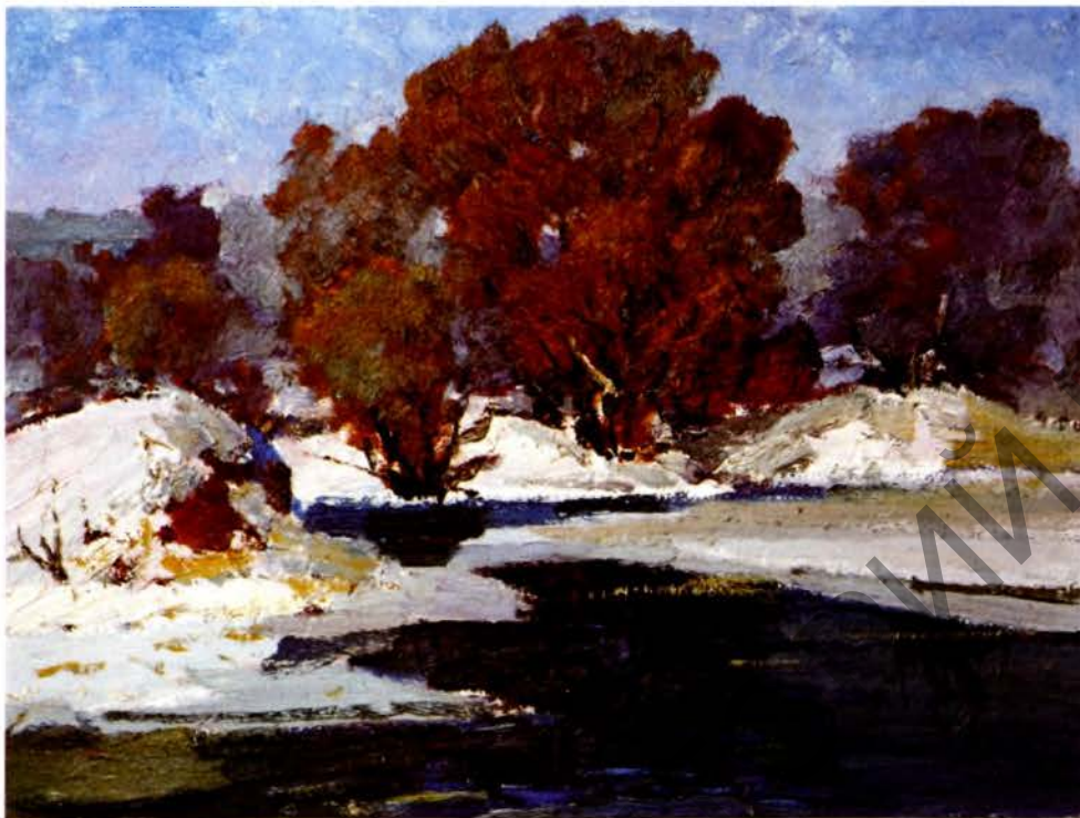
Сакавік. Кардон, алей. 1980.

У пейзажы – марскім, гарадскім, сельскім – Павел Масленікаў выяўляў вечную прыгажосць. Ён палка працаваў і рабіў тое, што любіў, – у гэтым было яго шчасце. З якім захапленнем