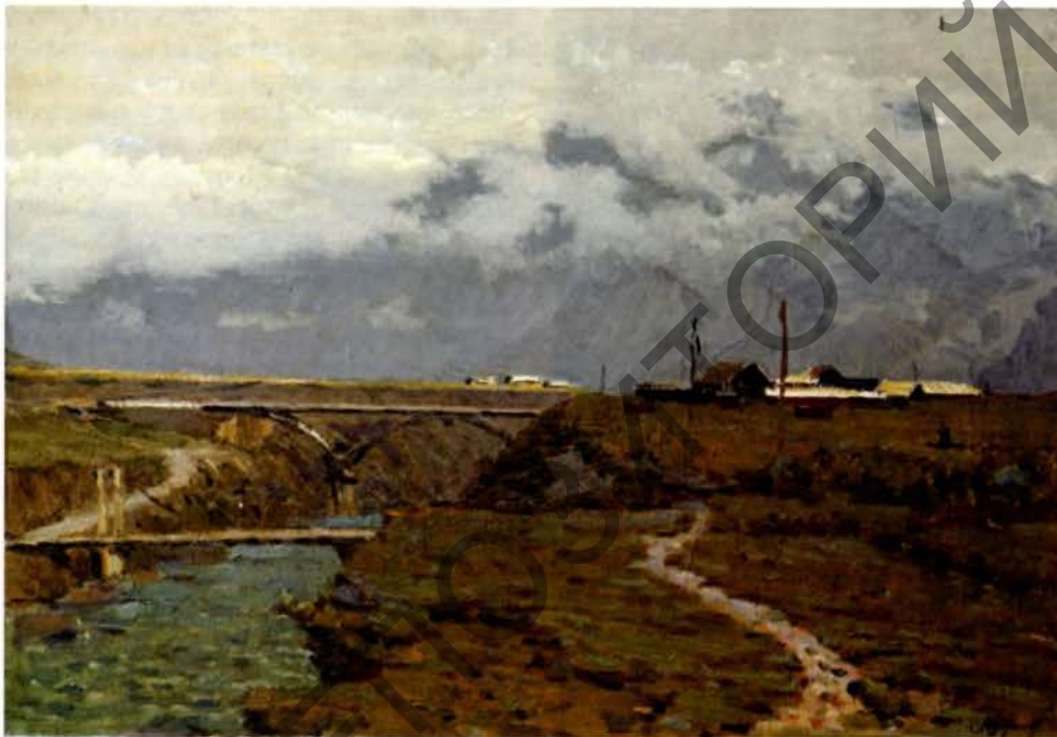
Масты праз Катунь. Палатно, алей. 1972.

ў кантрапунктычным сугуччы з матавай зеленаю елак адлюстроўваюць цякачасьць і адноснасьць часу, у якім складана вымераць вечнасьць і пераменлівасьць.