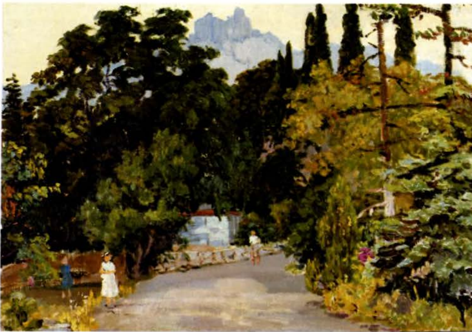
Місхор. Кардон, алей. 1959.