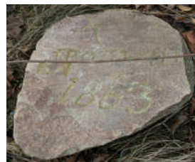
Малюнак 4 – Камень з лічбавым надпісам (1863)

Падрыхтоўка да святкавання ў розных сем’ях адрозніваецца ў залежнасці ад таго, памер ці не нехта са сваякоў дадзенай сям’і ў перыяд ад мінулагадніх Дзядоў да цяперашніх. Загадзя патрэбна знайсці прыгожы палявы камень, з дапамогай спецыяльнага інструмента, высекты на ім крыж і Галгофу (мал. 3–4). Даўней гэты працэс выконваўся ўручную зубілам і малатком, цяпер перавагу аддаюць больш сучасным прыладам.