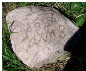
Малюнак 3 – Камень з надпісам АХМЗ (1647)