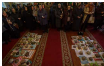
Малюнак 2 – Від з боку алтарнай часткі (2018)