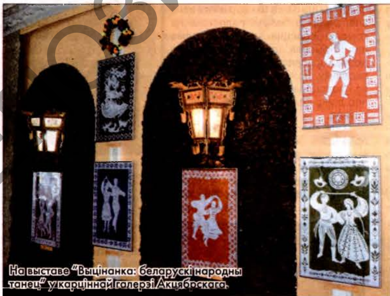
На выставе “Выцінанка: беларускі народны танец” укарціннай галерэі Акцябрскага.

Педагогі і навучэнцы сталічнага ЦДАДІМ “Ветразь” яшчэ раз ярка нагадалі пра сябе і ў Акцябрскай карціннай галерэі (загадчык Надзея Запруцкая) — без перабольшвання ўнікальнай выставай “Выцінанка: беларускі народны танец”. Мы, запрашаныя на фестываль журналісты, нават гадалі перад тым, як патрапіць на гэтую выставу: што ж усё-такі гэта будзе — слова “выцінанка” тут ужываецца ў прамым ці ў пераносным сэнсе? Маўляў, танец у нейкай ступені можна параўнаць з працэсам вырабу выцінанкі, з гэтакім выразаннем у паветры рухаў і скокаў... Аказалася, у прамым, але тым больш уражальным эфект мела экспазіцыя, у якой майстры з “Ветразя” сродкамі выцінанкі ўвасобілі яркія беларускія народныя танцы — “Каханачка”, “Матлёт”, “Кракавак”, “Лявоніха”, “Ночка”, “Чобаты”, “Мікіта”, “Падшачка”, “Кола”, “Ва-