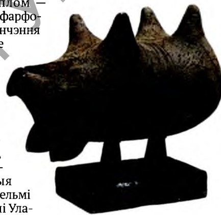
Прадчуванне. Дымленне, рэдукцыя. 2007.

Што да малой радзімы, то, безумоўна, усё адтуль: рэгіянальнае ў маіх працах перарастае ў нацыянальнае. Паданні, што з дзяцінства памятаю... На апошняй выставе паказаў «Судны дзень». Сабраліся продкі і пытаюць у нас, што мы зрабілі, што пакінулі сваім нашчадкам. Вось твор з апошніх: жанчыны ў намітках сапраўды падобныя да калон — іанічных, карыфскіх. Кампазіцыя, што цяпер у мяне на мальберце: «Збіральніцы святла». Таксама вобраз продкаў. Святло — гэта тое, што назапашана ў духоўным жыцці: ад Еўфрасіні Полацкай да Уладзіміра Караткевіча і Васіля Быкава. ■