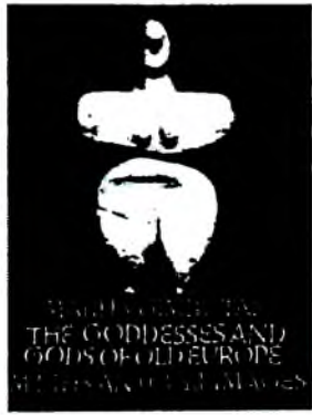
Выданні М. Гімбутас, прысвечаныя розным аспектам гісторыі і архаічнай культуры еўрапейцаў.

Вопытны археолог (бліскуча ведала артэфакты сусветнага палеа- і неалітычнага мастацтва, пахавальныя абрады, сімваліку арнаменту палеа-еўрапейцаў, балтаў, фіна-уграў, славян, германскіх і раманскіх народаў), М. Гімбутас дапоўніла артэфакты звесткамі з міфалагічных і рэлігійных сістэм Усходу, Захаду і Поўначы, падмацавала вынікі этнаграфічнымі ведамі звычай, каляндарных, абрадавых сістэм і містычных практык міжземнаморскіх, паўночных і цыркумбалтыйскіх народаў. У выніку матэрыяльны, светапоглядны і паводзінны бакі архаічных культур Еўропы былі скаардынаваны і сістэматызаваны з дапамогай суаднясення з этапамі старажытнай гісторыі Еўразіі. Вынайздзены археаэтымалагічны метады атрымаўся гіпертрафавана міждысцыплінарным, асацыятыўным і энцыклапедычным. Таму навуковы і культурны “бэкграўнд” даследчыка, які ім карыстаецца, павінен быць вельмі насычаным.