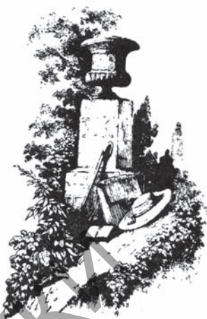
Віньетка. Ю. І. Крашэўскі

У канцы 1868 г. ён заснаваў сваю друкарню, у якой на высокім паліграфічным узроўні выдаваў творы польскіх аўтараў і кнігі польскай тэматыкі.