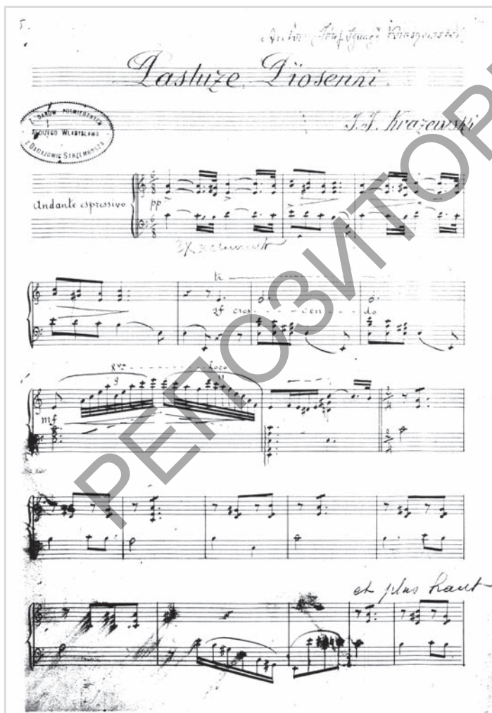
Старонка рукапісу твора Ю. І. Крашэўскага «Пастушыя песні» для фартэпіяна