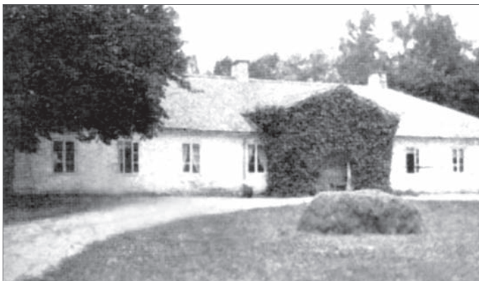
Маёнтак Стары Куплін

Пасля смерці К. Крашэўскага маёмасць спадчынных маёнткаў Раманава і Доўгае засталася за яго малодшым сынам Крыштафам, які ў 1913 г. падарыў рукапісныя зборы Ягелонскай бібліятэцы ў Кракаве, раскошны кнігазбор — бібліятэцы імя Г. Лапацінскага ў Любліне, а астранамічныя прыборы — Варшаўскаму навуковаму таварыству.