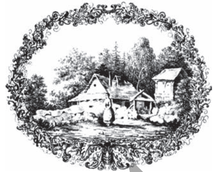
Ю. І. Крашэўскі. Вільянт да тытула «Літоўскага спеўніка» В. Кажынскага. 1854 г.

Пасля смерці Яна ў 1864 г. спадкаемцам маёнткаў Раманава, а пазней і Доўгае стаў яго малодшы сын Каятан Крашэўскі (1827—1896) — пісьменнік, кампазітар, астраном-аматар, заўзяты калекцыянер. У 2-й палове XIX ст. маёнтак Раманава стаў галоўнай рэзідэнцыяй роду Крашэўскіх. Пасля пажару 1858 г. была адбудавана новая мураваная сядзіба ў класічным стылі з радавым гербам на франтоне. У 70-я гг. на другім паверсе дома мясцілася прасторная бібліятэчная зала з кнігзборам каля 9000 тамоў. Сярод найбольш каштоўных