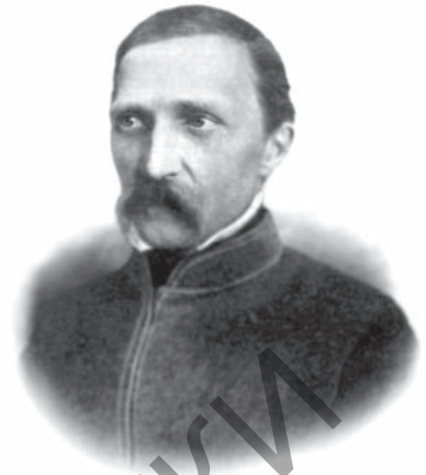
Юзаф Ігнацы Крашэўскі

Юзаф Ігнацы Крашэўскі як сумленны і неабаякавы чалавек меў сваю грамадска-палітычную пазіцыю ў час узмоцненай барацьбы за незалежнасць. Пазней, пасля 1853 г., ён напісаў прыгожы партрэт Тамаша Зана, вобраз якога стаў прыкладам чалавечка надзвычайнай сілы волі і душэўнай чысціні. У сакавіку 1832 г. Ю. І. Крашэўскі быў выпушчаны з турмы. Аднак да ліпеня 1833 г. знаходзіўся пад паліцэйскім наглядам, потым пакінуў Вільню і пераехаў у Доўгае, пазней у Гарадзец, што на Палессі, да сваіх добрых знаёмых Урбаноўскіх. Важным вогнівам у развіцці яго сферы інтарэсаў становіцца музыка. Тут ён зразу меў, што, акрамя танцаў і песень, папулярных мелодый і транскрыпцый з опер, існуе іншы свет музыкі — болей дасканалы і прыгажэйшы: інтэнсіўна знаёміцца з творчасцю Гайдна,