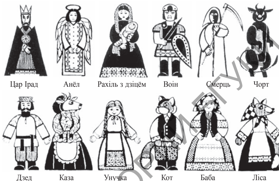
Мал. 2. Лялькі да драмы «Цар Ірад» і казачныя персанажы, якія можна зрабіць з драўляных загатовак

Для стварэння лялькавага вобраза абранага персанажа неабходна зрабіць адбор і падгонку адпаведных дэталей, замацаваць іх, апрануць, размяляваць бачныя часткі драўніны. Некаторыя этапы працы, а таксама ўзоры асобных персанажаў паказаны на малюнках 1, 2.