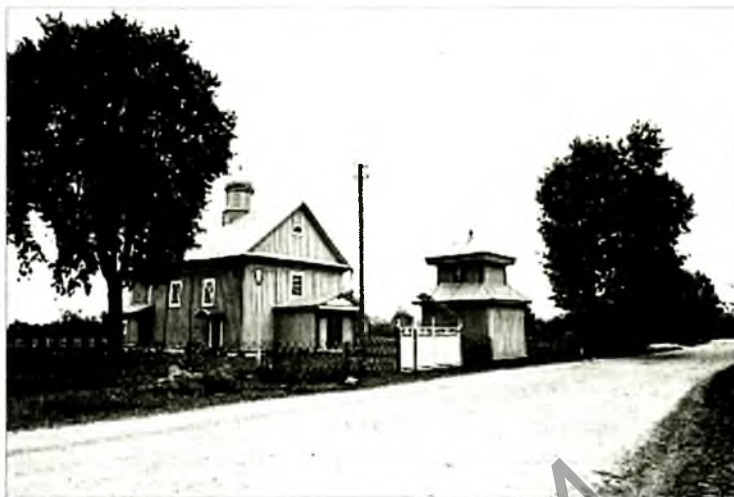
Царква Раства Божай Маці ў вёсцы Ляскавічы Іванаўскага раёна Брэсцкай вобласці. 1783 г.

Два другія ўзоры іканастасных саламяных варотаў з вёсак Лемяшэвічы Пінскага раёна і Вавулічы Драгічынскага раёна (былы Кобрынскі павет) шчасліва перажылі вандалізм часоў савецкай антырэлігійнай барацьбы і Другую сусветную вайну. Яны былі нанова адкрыты ў