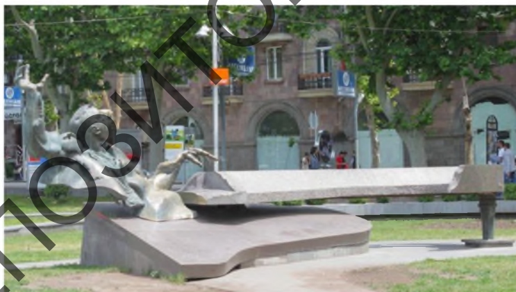
Рисунок 10. – Скульптурная композиция, посвященная А. Бабаджаняну, г. Ереван

Музыкальная тематика прослеживается во многих проектах с использованием облика рояля. Большинство из них посвящено великим пианистам-композиторам и исполнителям. Необычный памятник советскому армянскому композитору и пианисту Арно Бабаджаняну был установлен в 2003 г. в Ереване около театра оперы и балета. Авторы скульптурной композиции Д. Беджаниян и Л. Игитян запечатлели композитора, с большой экспрессией играющего на рояле. Некоторая условность и гротескность присутствует в изображении инструмента (большая монолитная каменная плита) и самого композитора (в его непропорционально больших руках, фигуре) (рис. 10). По мнению искусствоведа, деятеля искусств Армении Г. Итигяна «Арно был большой творческой личностью, которая достойна необычного памятника» [6].