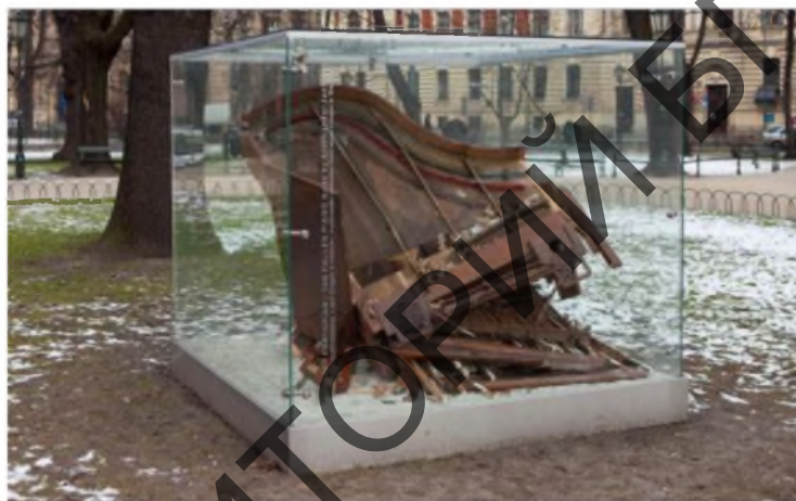
Рисунок 13. – Инсталляция «Упавший рояль», г. Краков

В Кракове находится уникальная инсталляция «Упавший рояль» (рис. 13). Экспонат является частью проекта «Шопен в городе» и представляет собой разломанный корпус, из которого звучит музыка великого композитора.