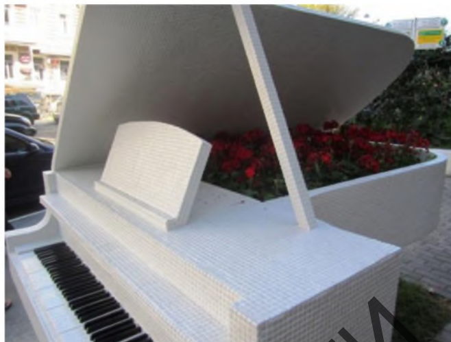
Рисунок 11 (слева). – Скульптура «Рояль» К. Скритуцкого, г. Киев, 2011 г. Рисунок 12 (справа). – Скульптура «Рояль» с цветочной клумбой