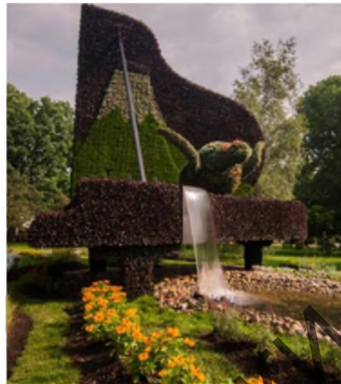
Рисунок 5, 6. – Цветочная скульптура «Рояль», г. Монреаль, 2013 г.

Образ рояля как важнейшего музыкального инструмента камерной музыки использовал в своей скульптурной композиции современный голландский художник-инсталлятор Флорентин Хофман (Florentijn Hofman). Художник получил известность благодаря созданию крупногабаритных фигур, изображающих понятные всем предметы, размещенные в городском пространстве. Среди них – 26-метровая скульптура желтого резинового утенка, плавающего по реке Луаре, созданная в рамках выставки современного искусства Estuaire-2007. По утверждению автора «дружественный плавающий утенок обладает исцеляющими свойствами и может помочь в разрешении мировой напряженности» (ссылка). Другая работа Ф. Хофмана – гигантская ондатра в поселке Ньюверкерк на реке Эйссел в Южной Голландии – создана как символ проблемы, которую создают эти животные для жителей Нидерландов, разрушая дамбы.