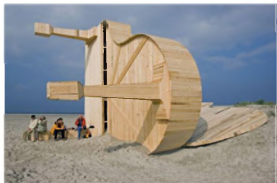
Рисунок 7, 8. – Инсталляция Ф. Хофмана «Затонувшие рояли», о. Схирмонниког, 2007 г.

По примеру производителей роялей, размещающих название своей фирмы над клавиатурой, художник поместил надпись со своей фамилией (Hofman&sons) на корпусах созданных им скульптурных изображениях инструмента по аналогии с фирмой «Steinway&sons» (рис. 9).