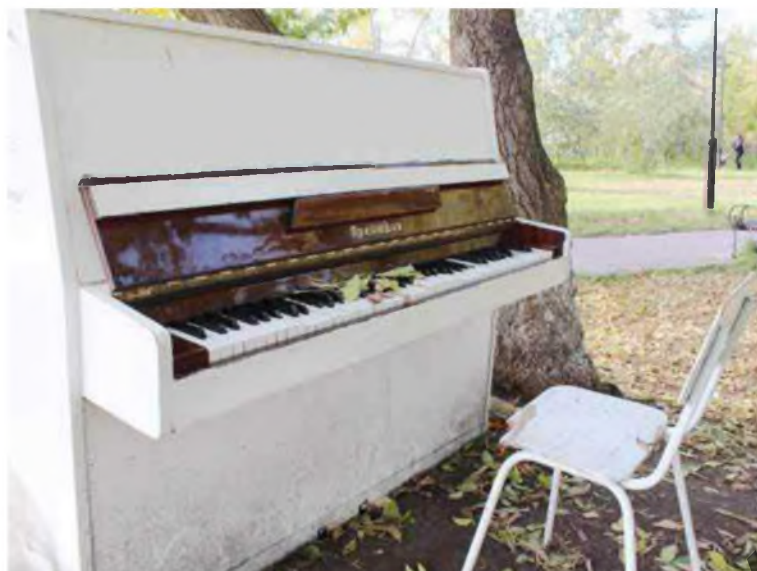
Рисунок 1. – Отреставрированное пианино в парке г. Красноярска