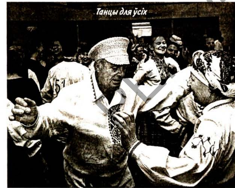
Танцы для ўсіх