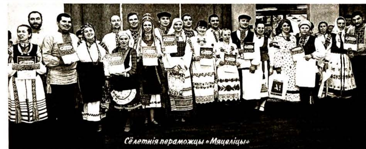
Сёлетнія пераможцы «Мяцеліцы»