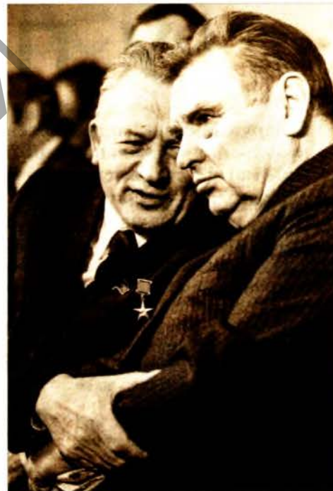
Максім Танк і Іван Шамякін.

Удалы партрэт можа атрымацца толькі тады, калі паміж фатографам і героем існуе павага і ўзаемаразуменне. А што тычыцца работы з дзеячамі культуры, то ўвогуле фатограф павінен прадумаць