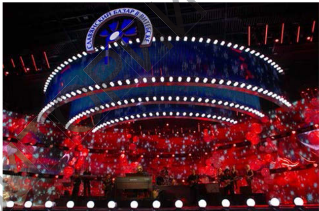
Рис. 2. Международный фестиваль «Славянский базар в Витебске». 2010 г.