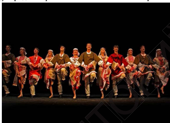
Рис. 5. «Могилевская музыкальная весна», выступление Государственного ансамбля танца Беларуси. 2014 г.