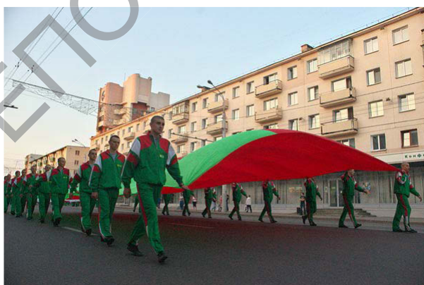
Рис. 6. Парад, посвященный Дню Независимости Республики Беларусь. Минск, 2013 г.