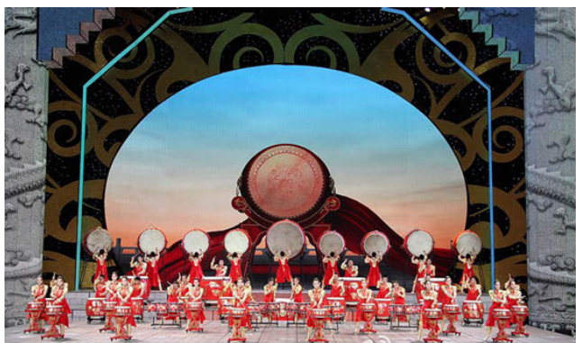
Рис. 3. Сводный перкуссионный оркестр исполняет композицию «Полет дракона» в музыкальном шоу, посвященном китайскому Новому году. 2012 г.