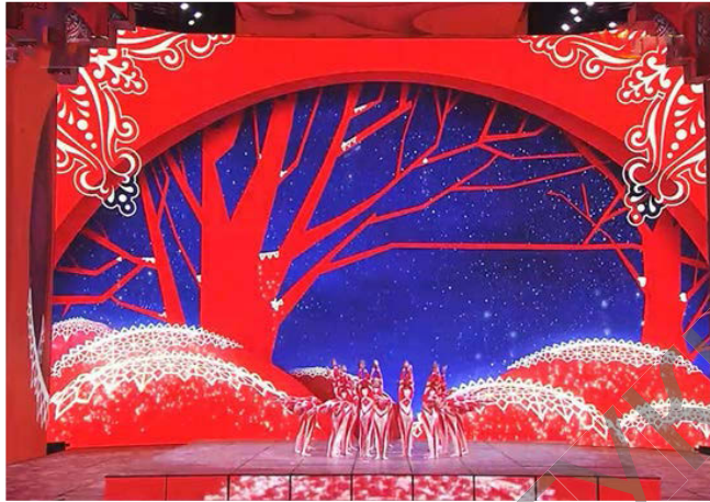
Рис. 1. Музыкальное шоу, посвященное Празднику весны (китайский Новый год). 2012 г.